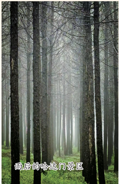
雨后的哈达门景区