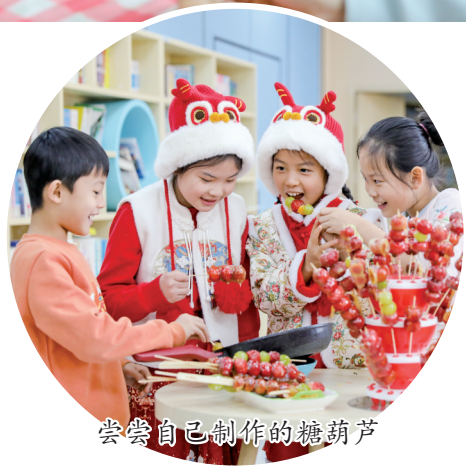
尝尝自己制作的糖葫芦