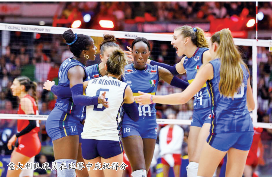
意大利队球员在比赛中庆祝得分