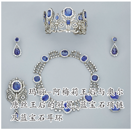
玛丽-阿梅莉王后与奥尔唐丝王后的冠冕、蓝宝石项链及蓝宝石耳环

媒体援引法国官员的话报道,整个作案过程只持续了7分钟。等安保人员稍后到达作案地点时,已经“人去楼空”。不过,嫌疑人作案花了多少时间目前众说纷纭,法国文化部长拉茜达·达蒂在接受采访时说,作案时间不到4分钟。