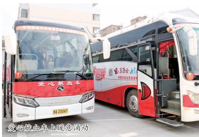
爱心献血车上暖意涌动