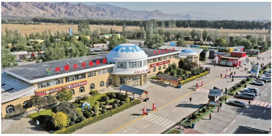
哈素海服务区

呼和浩特西服务区全新打造十二盟市特产集聚专区,多方位展现“天赋河套”“锡林郭勒草原”“科尔沁沙地”等地域特色,构建“特色