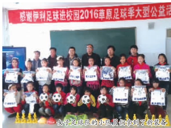
女子足球队的小队员们拿到了新装备

的欢声笑语也随着校车逐渐远去,融入到崇山峻岭中。小队员们抱着心爱的寒假礼物,彼此约定:等开学的时候,一定要穿上漂亮的训练服,更加刻苦的足球训练,为草原的足球运动争光。