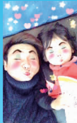
陆毅P出一组搞怪图片,有网友评价“你可能发了个假微博”。