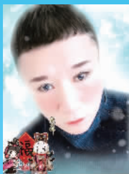
孙红雷P的造型让网友大呼“辣眼睛”