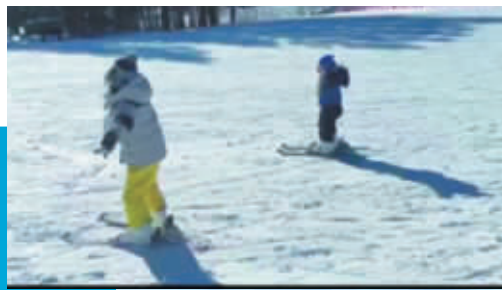
邓超 家两个孩子 学滑雪

这个春节假期你是怎么过的?吃吃喝喝陪陪家人还是出门远游看看世界?是晒点美图发点祝福还是搞怪逗趣一起嗨?其实,明星们也跟大家一样,有着相似的假期娱乐活动。