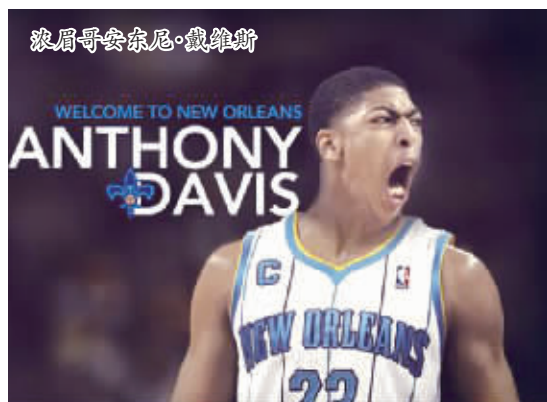
浓眉哥安东尼·戴维斯