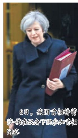
8日,英国首相特蕾莎·梅在议会下院参加首相问答

案,并由下院议员再进行辩论。这份只有两句话的法案最终并未受到任何修正。此次投票是下院对最终法案的程序性批准,最终通过并无悬念。但该法案在辩论阶段导致反对党工党内部出现分裂,部分影子内阁成员不顾党魁科尔宾告诫,投出反对票,并最终选择辞去影子内阁成员职务。这份法案将随即被提交给英国上议院,并由上议院议员在20日开始