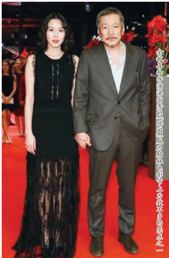
金敏喜和导演洪尚秀的「绯闻」成为柏林电影节上为数不多的亮点之一

此前备受中国影迷关注的张震没能获奖，自然也没有什么可以引发讨论和关注的话题。这种爆冷的情况甚至让业内人士调侃为，还没有注意到柏林电影节的开幕，就已经结束了。