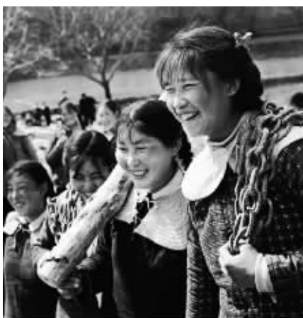
上世纪60年代,修建红旗渠的铁姑娘们。