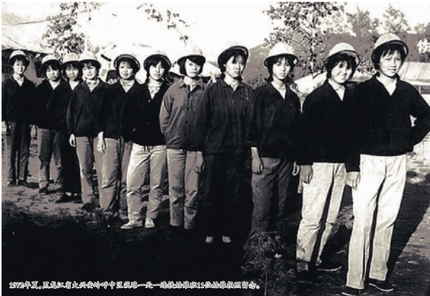
1972年夏,黑龙江省大兴安岭呼中区筑路一处一连铁姑娘班11位姑娘拍照留念。