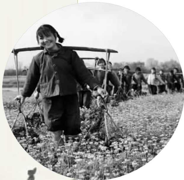
1972年3月,汨罗县汨罗公社向阳大队铁姑娘队送春肥。