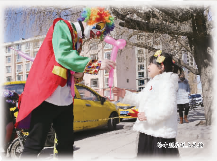
给小朋友送上礼物