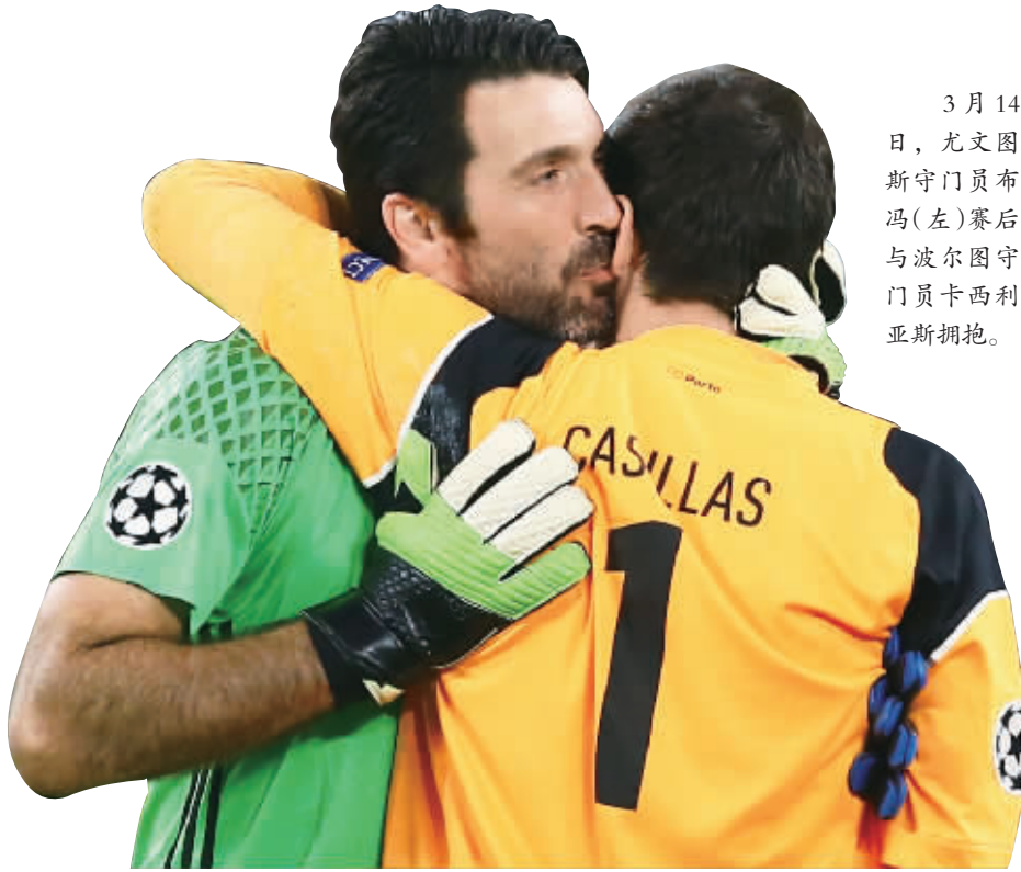
3月14日，尤文图斯守门员布冯(左)赛后与波尔图守门员卡西利亚斯拥抱。

当日，在欧冠1/8决赛第二回合比赛中，英超莱斯特城主场2:0战胜西甲塞维利亚，以总比分3:2晋级8强。意甲尤文图斯主场以1:0战胜葡超波尔图，从而以3:0的总比分晋级8强。(据新华社报道)