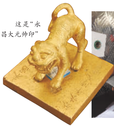
这是“永昌大元帅印”

石龙对石虎，金银万万五。谁人识得破，买断成都府……这是四川省眉山市彭山区江口镇流行数百年的一支歌谣，说的正是明末农民起义领袖张献忠“江口沉银”一事。2015年底，专家确定彭山“江口沉银遗址”为张献忠沉银中心区域之一。经过近3个月的挖掘，今年3月20日14时，“张献忠江口沉银遗址”考古召开新闻发布会，通报发掘最新进展，出水文物近2万件，实证确认张献忠江口沉银传说。