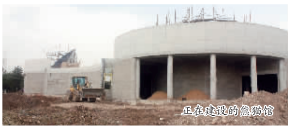
正在建设的熊猫馆