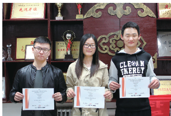
展示获奖证书

该赛事的最佳成绩。美国大学生数学建模竞赛由美国数学及其应用联合会主办,竞赛以3人(本科生)为一组,在4天内就指定的问题完成从建立模型、求解、验证到论文撰写的全部工作,每年都能吸引大量著名高校参赛。该项竞赛着重强调研究问题、解决方案的原创性,团队合作、交流以及结果的合理性。