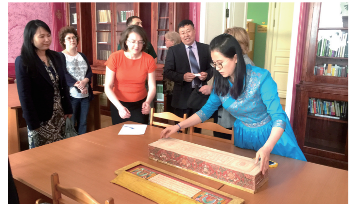
2016年5月24日,内蒙古图书馆访问俄罗斯国立图书馆东方文献中心,举行了“数字文化走进蒙古包”和“彩云服务”宣传推广报告会。