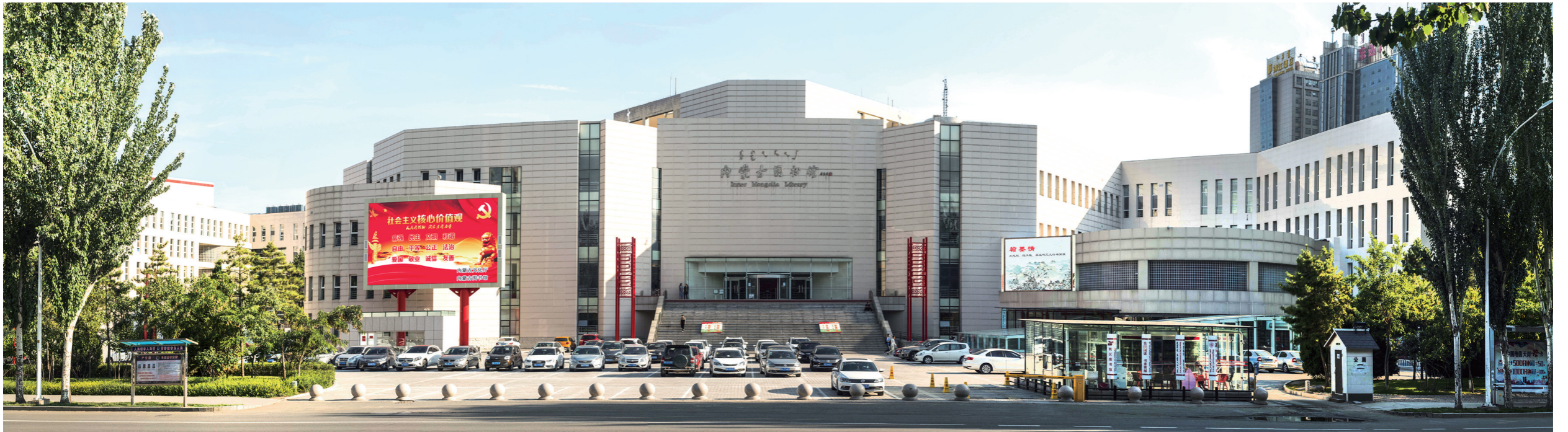
内蒙古图书馆改扩建后的新馆面貌。