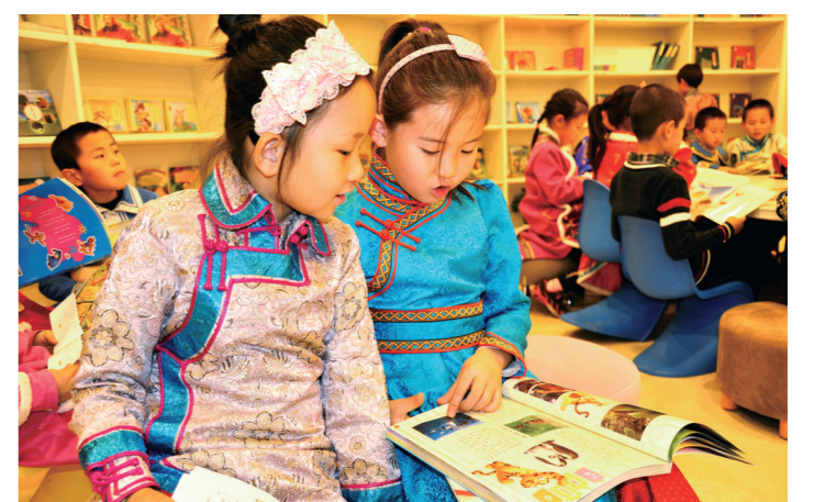
蒙古族小读者在少儿馆蒙文阅览室阅读蒙文儿童读物。