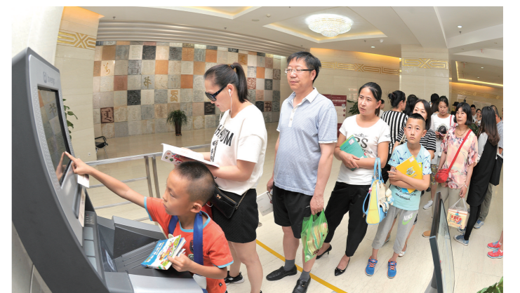
利用自助还书系统,读者通过“彩云服务”在实体书店借购的图书,可方便快捷地还回图书馆。