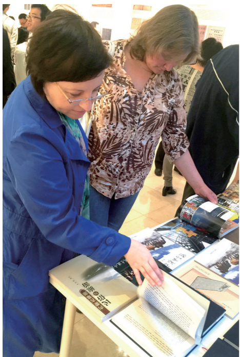
2016年5月23日,莫斯科中国文化中心第四届“品读中国”读书周期间,内蒙古图书馆举办了馆藏草原精品图书展,受到了俄罗斯友人的欢迎。

内蒙古图书馆紧紧抓住社会发展需求,适应时代潮流,坚持为大局服务、为文化建设服务、为人民群众服务的宗旨,因地制宜、因馆制宜,探索出一系列行之有效的、可复制的服务模式,这些服务模式自实施以来取得的效果有目共睹。将这些服务模式推广出去,让它们发挥更大的功用成为内蒙古图书馆的新目标。