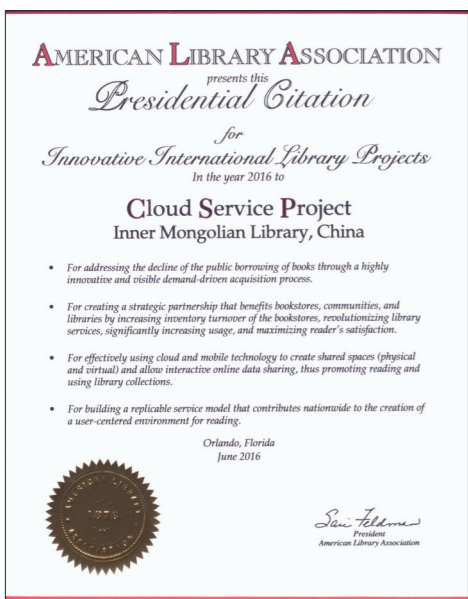
彩云服务 荣获2016年美国图书馆协会(ALA)美国图书馆协会主席国际创新奖。