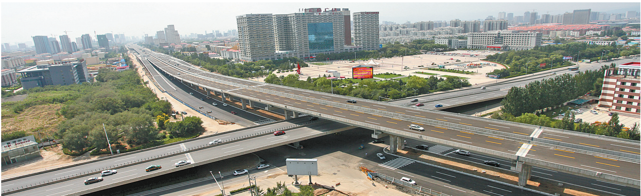
呼和浩特南二环快速路与昭乌达路交叉路口。