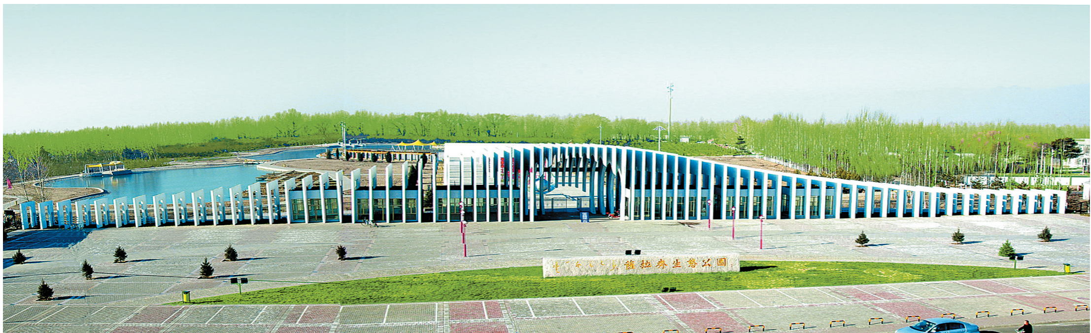
土右旗生态公园。