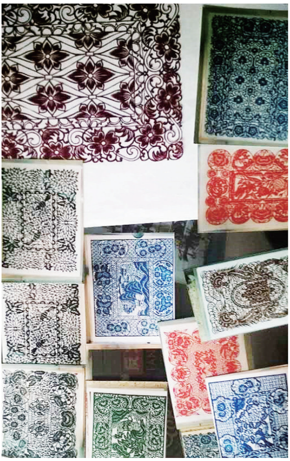
邢逊的花朵图案剪纸作品。