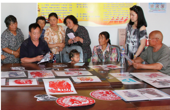
红山剪纸传承基地三眼井村培训课堂。