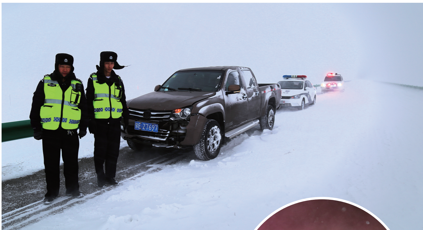
白雪茫茫,能见度极低。