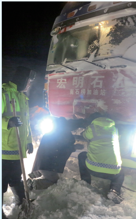
民警和司机一块修车。