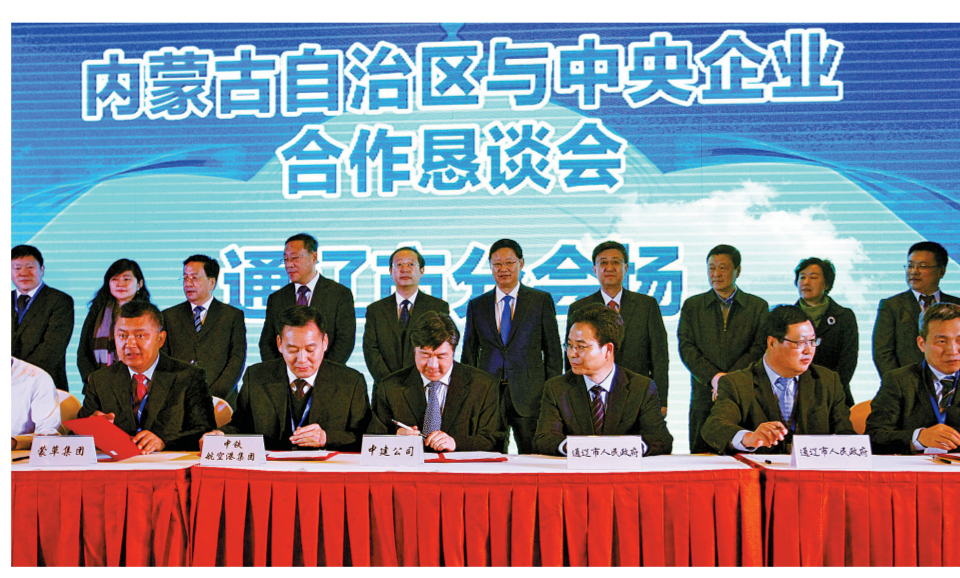
通辽市分会场签约现场