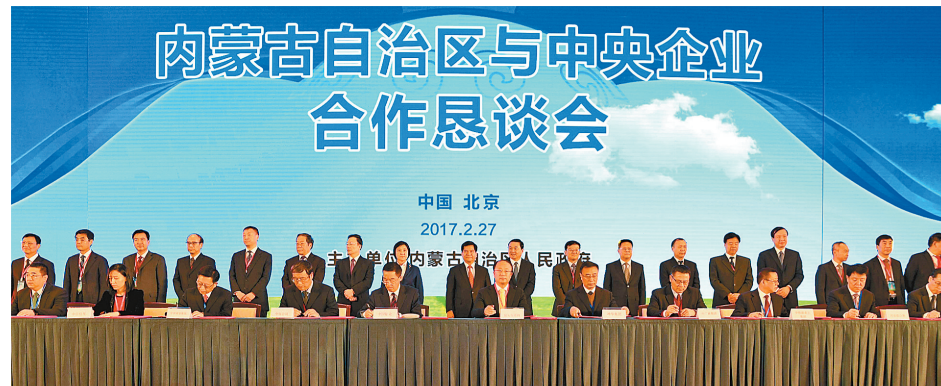
自治区政府与央企签约现场