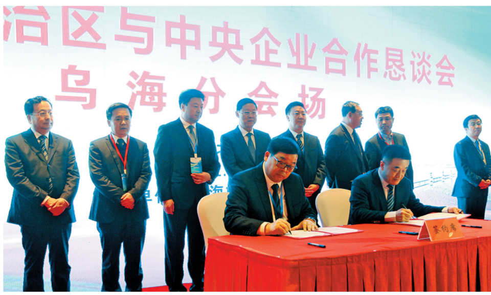
乌海市分会场签约现场