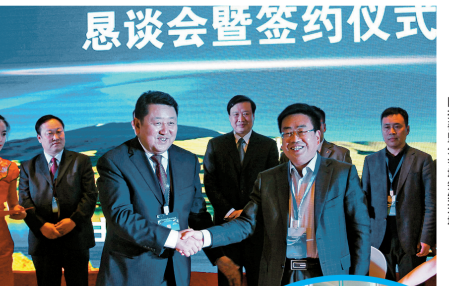
阿拉善盟分会场签约现场