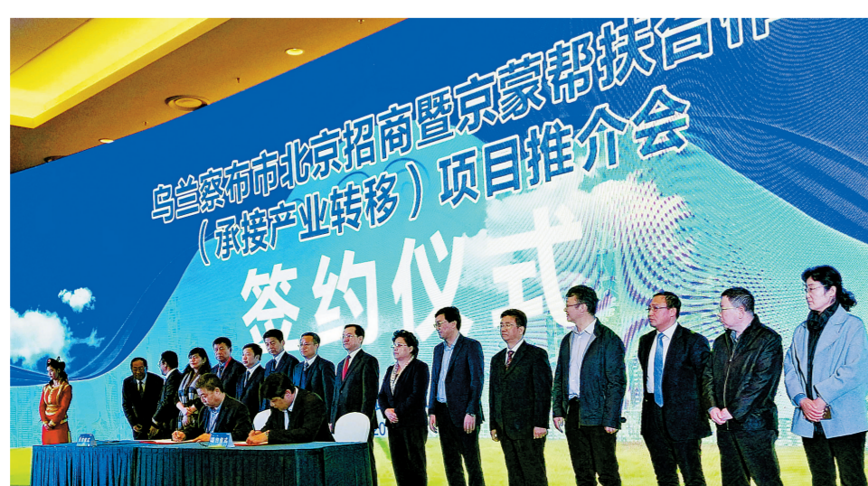
乌兰察布市分会场签约现场