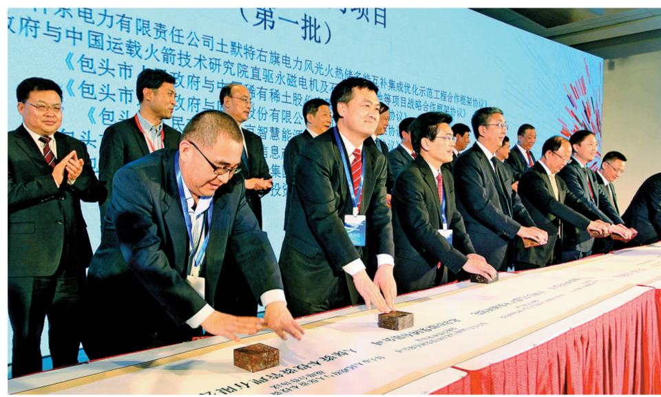
包头市分会场签约现场