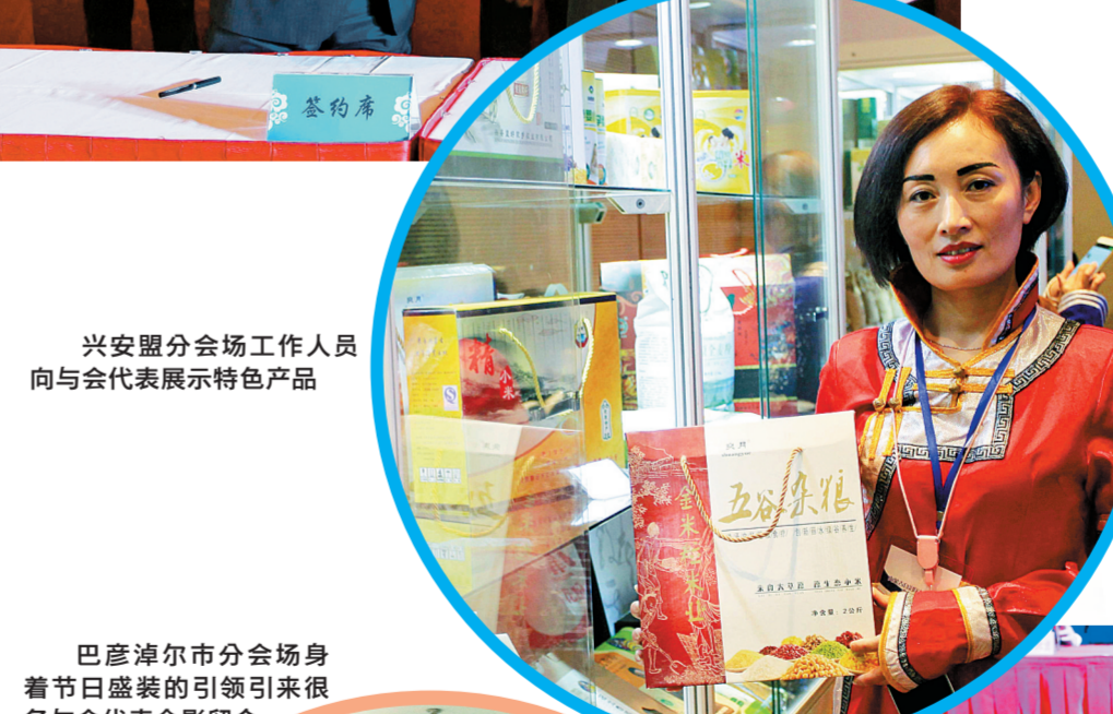
兴安盟分会场工作人员向与会代表展示特色产品