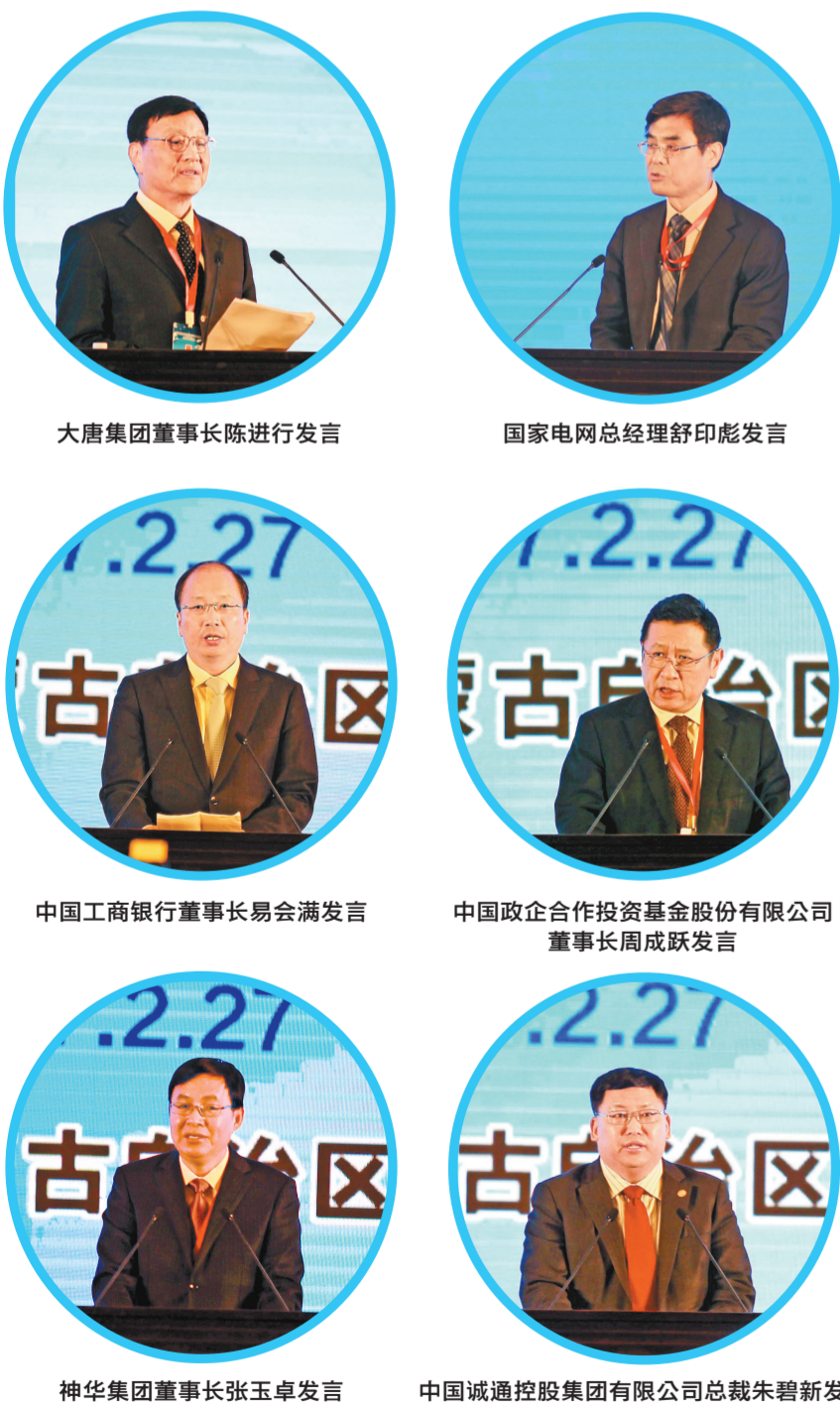
大唐集团董事长陈进行发言 国家电网总经理舒印彪发言 中国工商银行董事长易满发言 中国政企合作投资基金股份有限公司董事长周成跃发言 神华集团董事长张玉卓发言 中国诚通控股集团有限公司总裁朱碧新发言