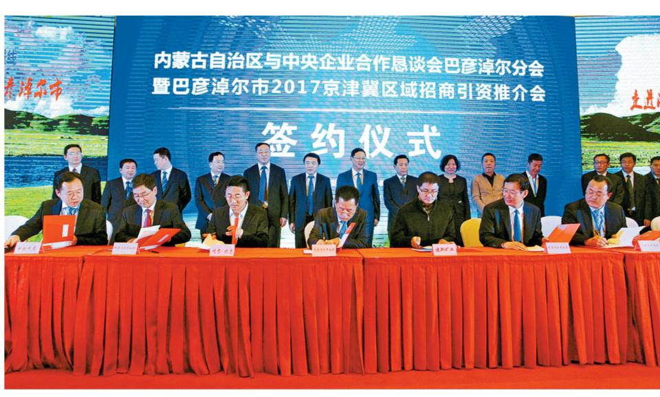
巴彦淖尔市分会场签约现场