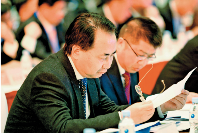
认真阅读相关材料