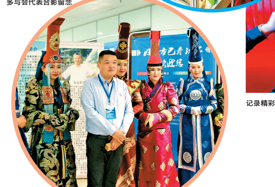
巴彦淖尔市分会场身着节日盛装的引领引来很多与会代表合影留念