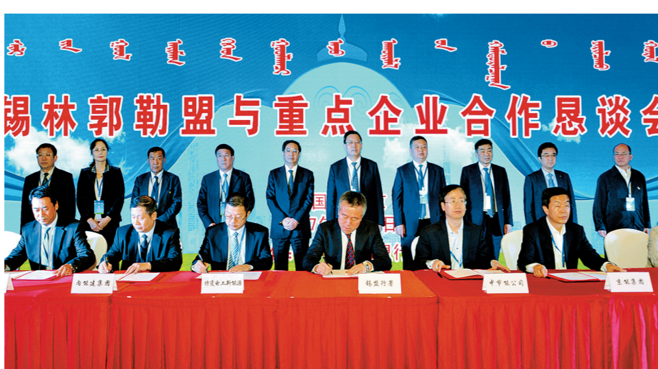
锡林郭勒盟分会场签约现场