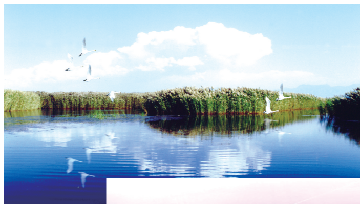
纳林湖生态旅游区