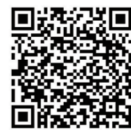
新闻连连看 扫一扫,看视频