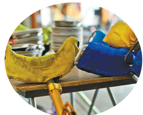
常年的训练使得独轮高车的车座也磨出了破洞。

《五人踢碗》曾获首届中国金菊奖杂技比赛优秀节目奖、最佳服装设计奖,“金狮奖”第6届全国杂技比赛金奖,第23届意大利金色马戏节金奖,第28届法国“明日”世界杂技节银奖等奖项。作为内蒙古“蒙派”杂技的代表作之一,《五人踢碗》为中国在国际舞台上赢得了众多荣誉。