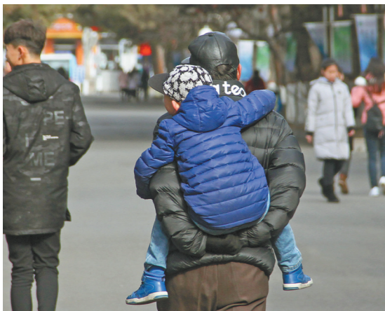
爷爷背着孙子漫步在公园内。