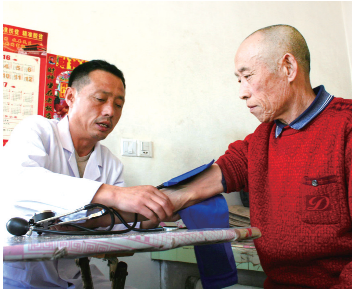
签约医生定期到贫困户家随访。

为了提高贫困人口健康水平,从2016年起,赤峰市在敖汉旗进行健康扶贫模式健康扶贫爱心基金、配备贫困户家庭医生等举措的推出,群众看得起病、看得好病、看得上病、少生病的愿望正在逐步实现。今年,全市将推广敖汉旗的健康扶贫模式,为更多贫困地区百姓送去健康福音。