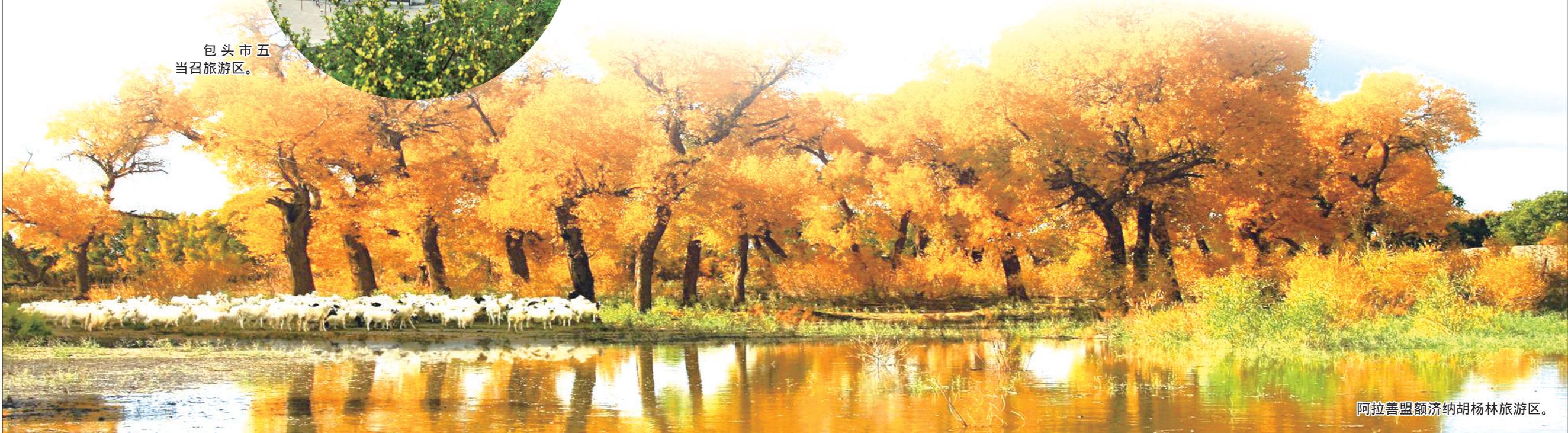
阿拉善盟额济纳胡杨林旅游区。