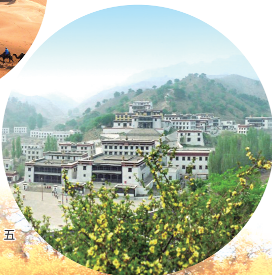
包头市五当召旅游区。