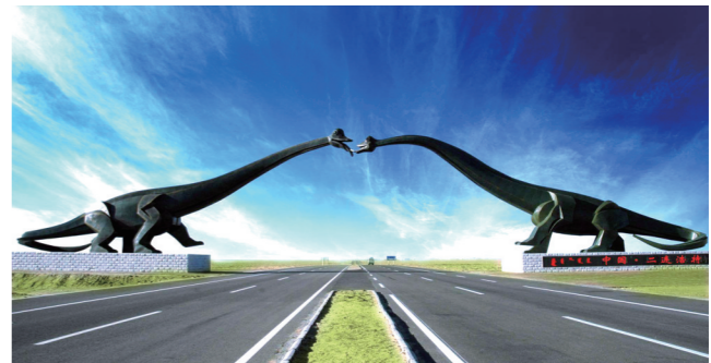
二连浩特市中蒙跨境旅游合作示范区。