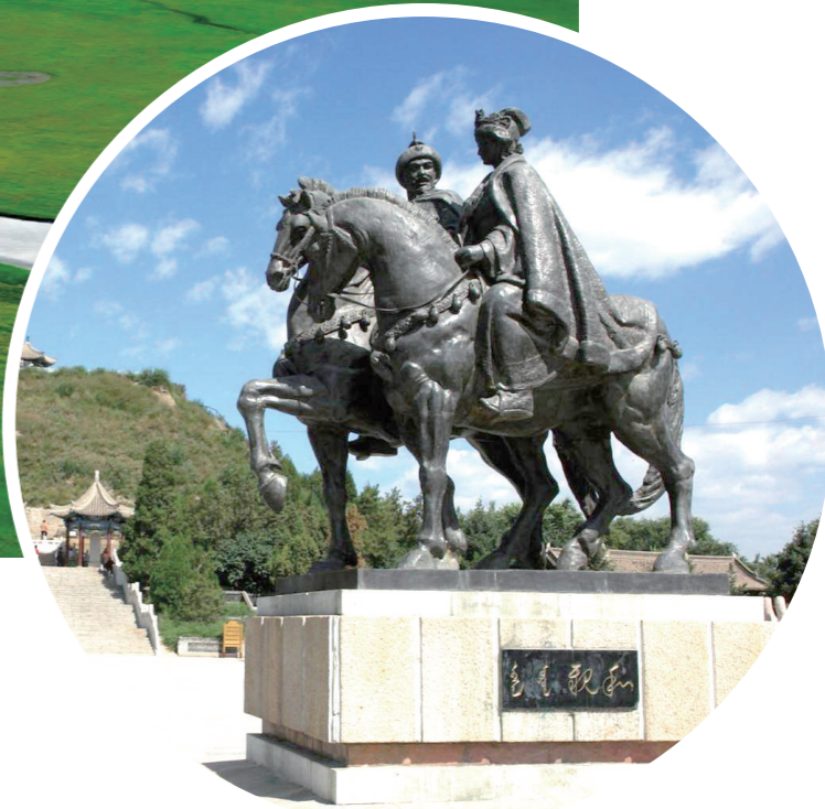
呼和浩特市昭君文化旅游区。