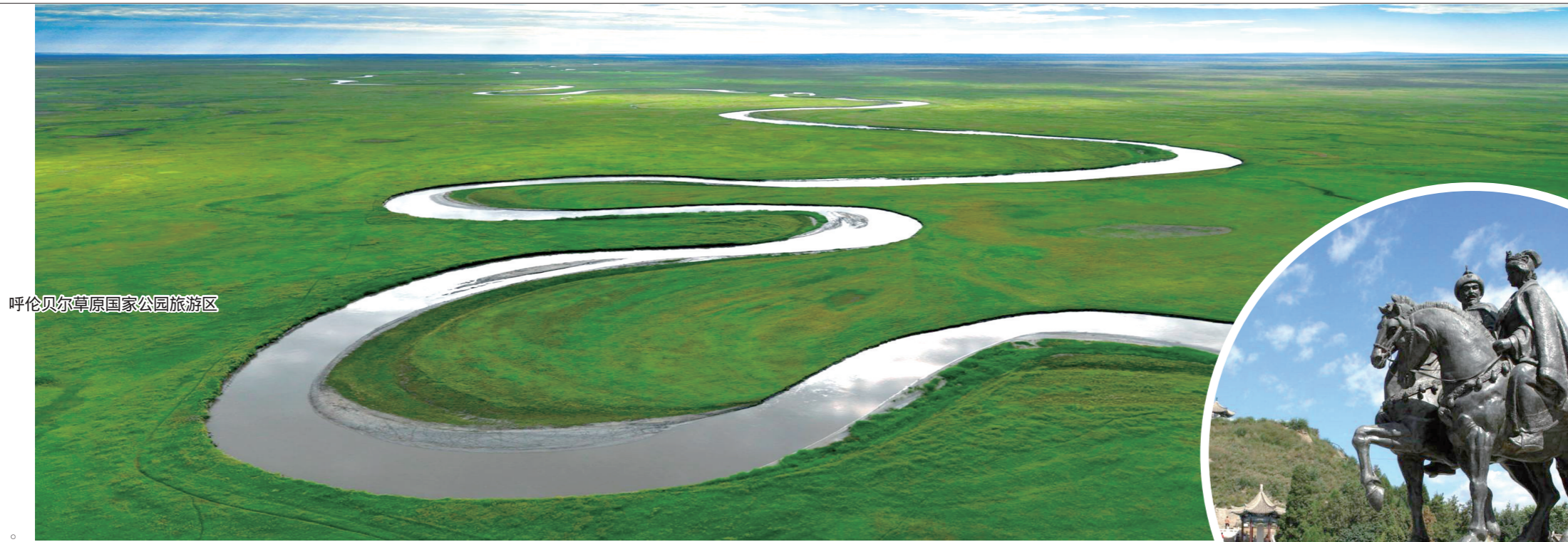
呼伦贝尔草原国家公园旅游区