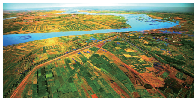
巴彦淖尔市黄河河套文化旅游区。

以文化和自然资源为依托,以消费市场细分为目标,构建跨国、跨区域、跨盟市的三级旅游线路体系,打造100条精品旅游线路。围绕“万里茶道、寻找成吉思汗之旅、丝绸之路、国际商贸之旅、养生医疗之旅以及亚欧大陆铁路专列”等打造跨区域旅游线路,围绕寻找祖国最北方、走西口、草原有约、游牧文化、黄河农耕文化之旅、长城之旅等打造跨区域旅游线路,围绕草原、森林、冰雪、民族风情游等打造跨盟市旅游线路。跨盟市旅游线路,分为自然、文化和专项3大主题,依托自然景观打造北疆天路、冰雪天路、黄河几字湾大漠风情线、大草原、大兴安岭全生态旅游等自然主题旅游线路,围绕游牧文化打造草原马道、蒙古源流黄金线、匈奴探秘、鲜卑溯源、三都深度游等文化主题旅游线路,开发自驾、低空飞行、沙漠探险、农牧业观光等特色旅游项目,打造专项主题旅游线路。