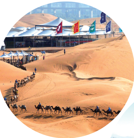
鄂尔多斯市响沙湾休闲度假旅游区。

此前,2月25日在回民区段家窑村大盛魁影视城,举办了重走古驼道,寻梦大盛魁,发展旅游业的系列活动,上万人跟随驼队徒步重走一段当年驼道。