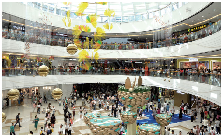
第三产业蓬勃发展。