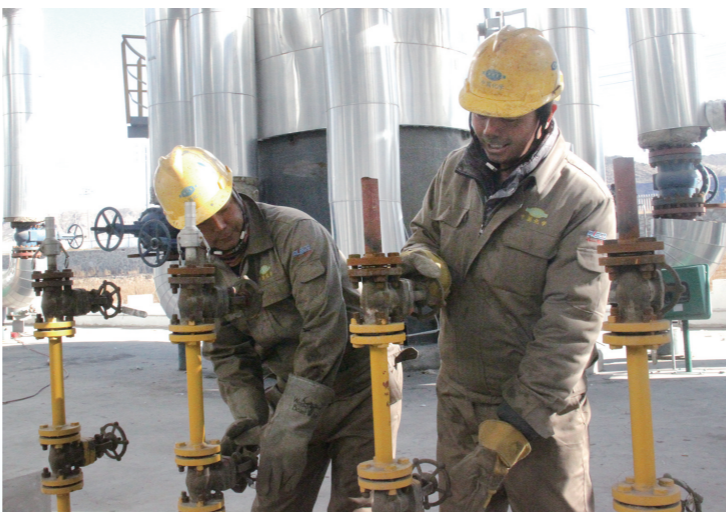
源通煤焦化焦炉煤气制LNG项目正在加紧建设。

不到乌海市,就感受不到这里大项目发展的滚滚热潮;不来乌海市,就感受不到这里蕴藏的无穷魅力。如今的乌海市正像磁铁一样吸引着来自世界各地的目光。