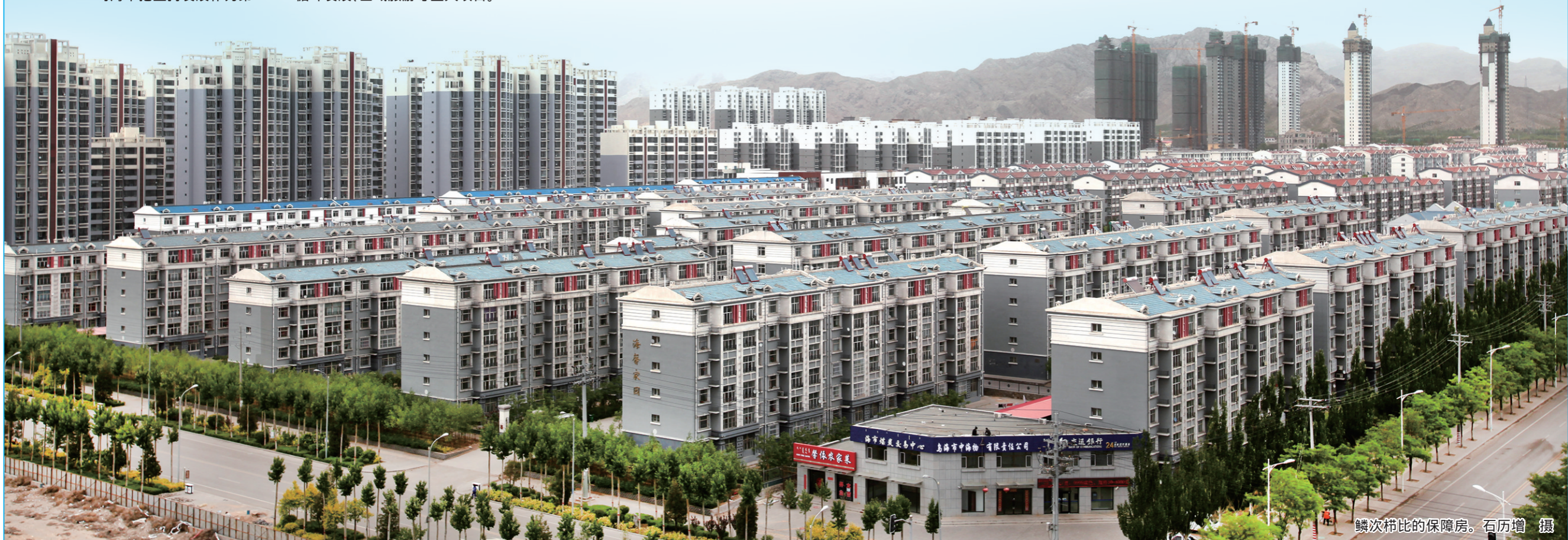
鳞次栉比的保障房。