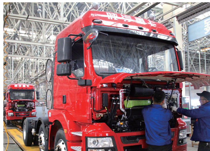
生产线上的陕汽新能源重卡。

此外,乌海市还将多渠道、全方位宣传乌海湖旅游,办好“丝绸之路·中国·乌海沙漠葡萄酒文化节”“乌海湖沙漠越野、马拉松、环湖自行车等节庆赛事”,打造集观光旅游、体育竞技、文化于一体的乌海湖黄金岸线。