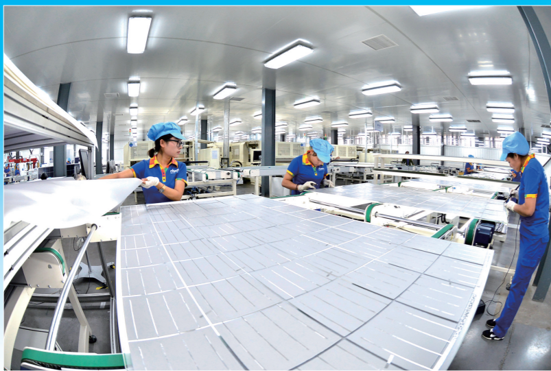
东方日升太阳能电池组件生产线。