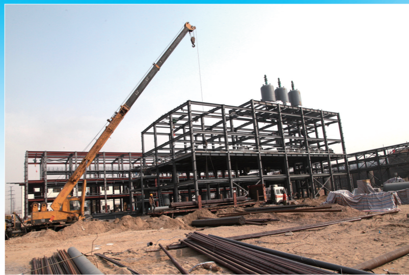
建设中的乌海黄河贝特瑞中间相炭微球项目。