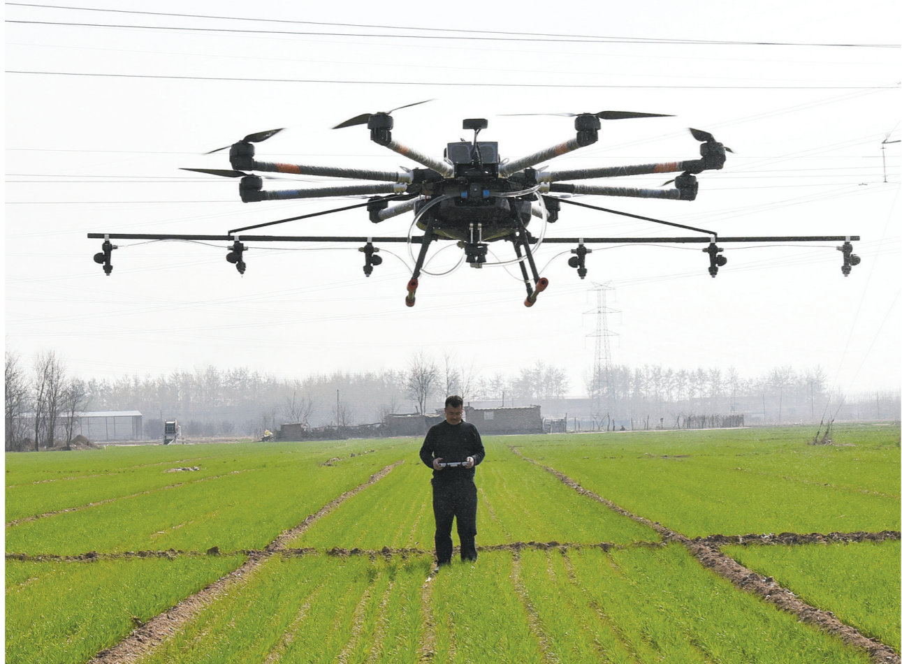
无人机助力春管作业

利息收入是商业银行盈利的重要来源，但受息差收窄等因素影响，五大行的利息净收入均有所下滑。工行利息净收入较上年减少360亿元、农行减少380亿元、中行减少226亿元、建行减少399亿元、交行减少93亿元。但与此同时，作为商业银行转型重点的中间业务表现良好，各行的手续费及佣金净收入均有所增长。