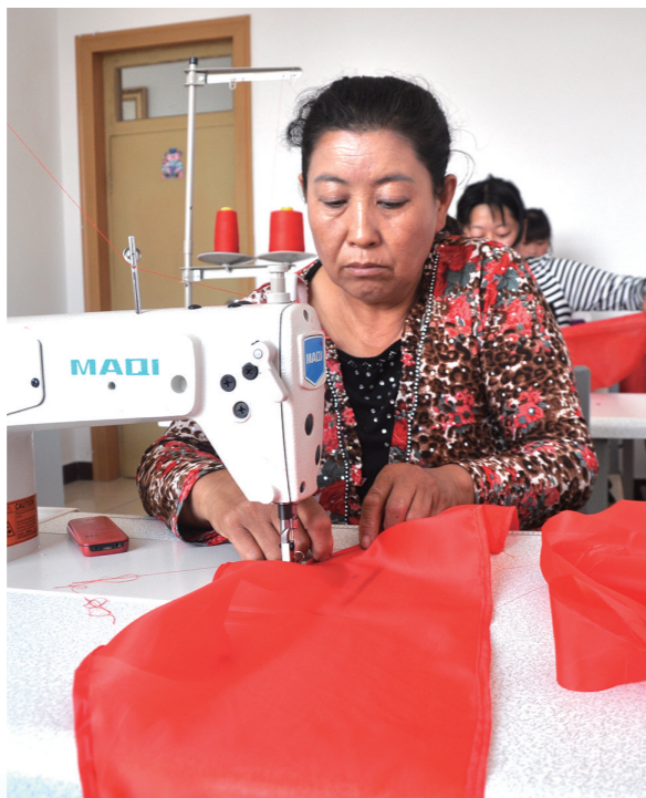
手工艺加工企业让贫困户实现居家就业。