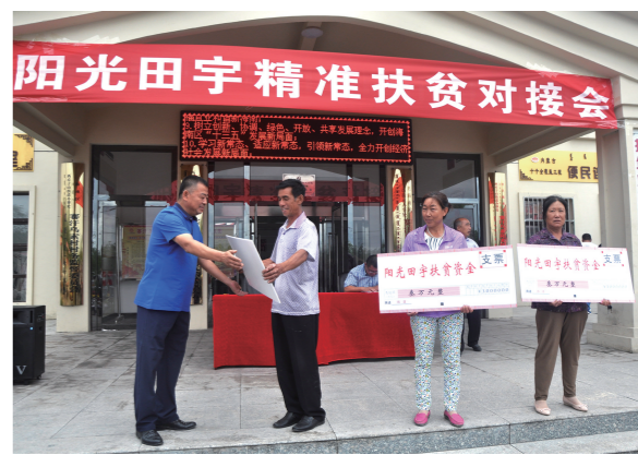
企业与农户结对精准扶贫。