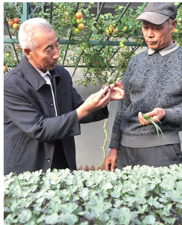
科技员指导温室种植。