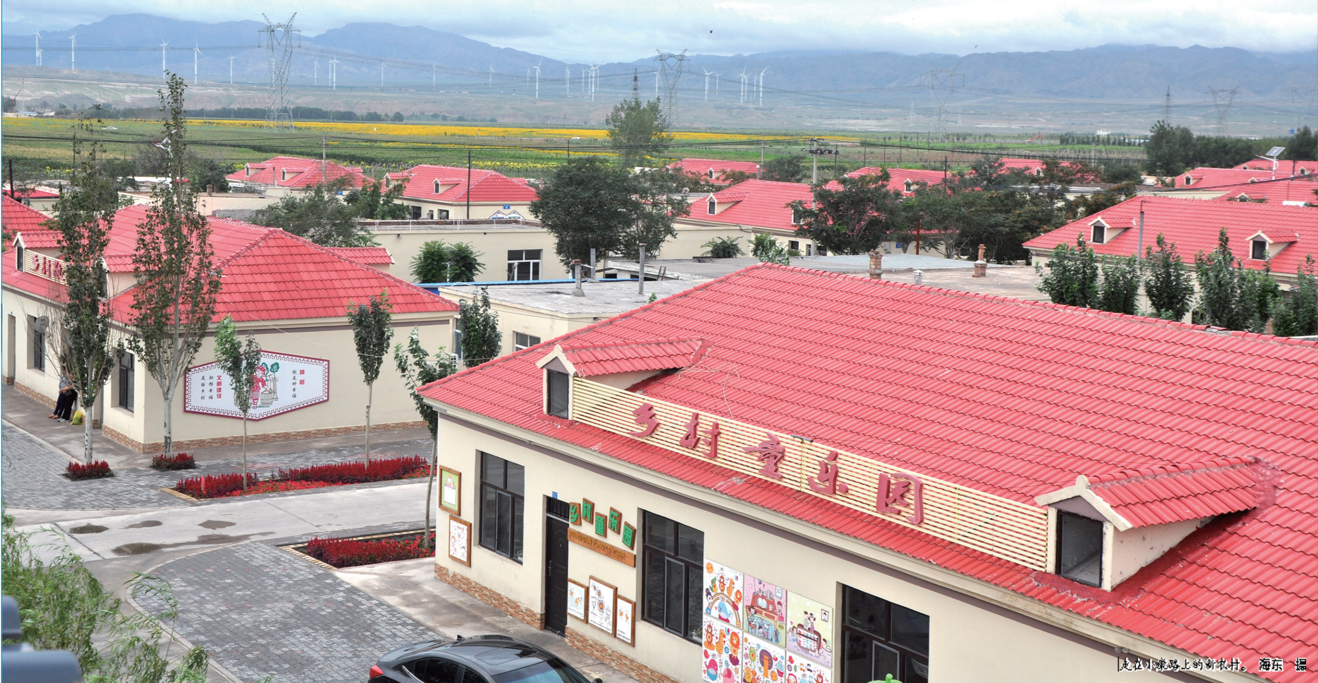
走在小康路上的新农村。