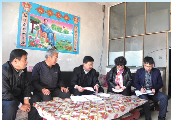
自治区脱贫攻坚督查组深入贫困户家中摸底。

乌海市将脱贫攻坚作为头号民生工程 and 重大政治任务扛在肩上、抓在手中,制定高标准的脱贫目标,精准发力、因贫施策,让贫困户真正实现造血能力,不让一名困难群众在小康路上掉队,一场高水平、高质量的脱贫攻坚正在乌海上演。截至2016年底,该市实际完成减贫1424人,仅剩89人未脱贫。