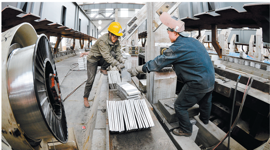
4月15日,内蒙古华云新材料有限公司50万吨合金铝产品结构调整升级技术改造项目车间,工作人员正在安装调试设备。