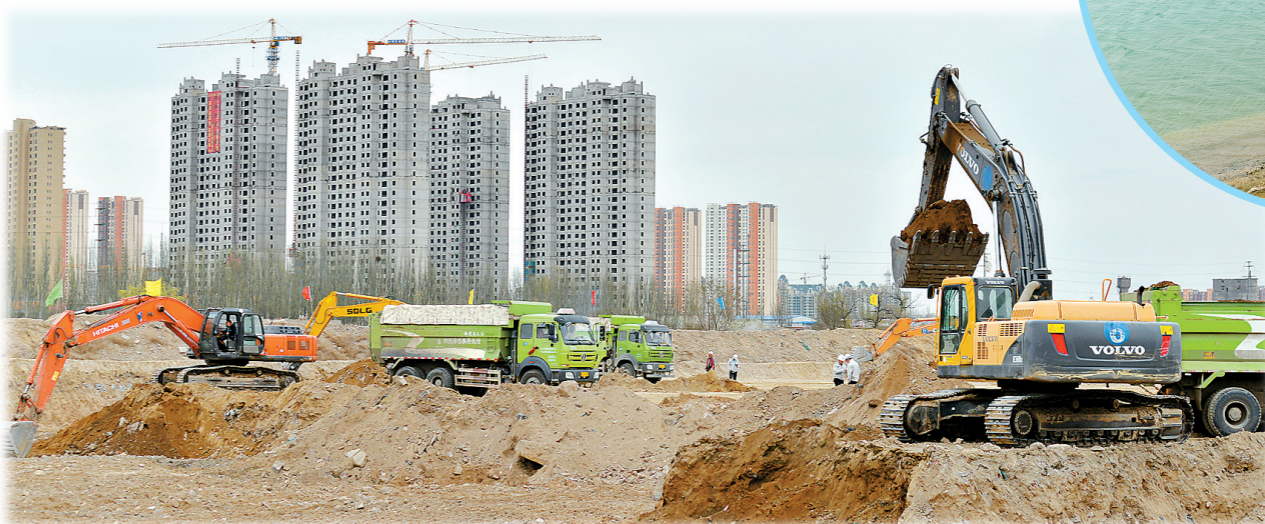
4月15日,包头市城市水生态提升综合利用工程现场,工程车辆往来穿梭,一片繁忙。