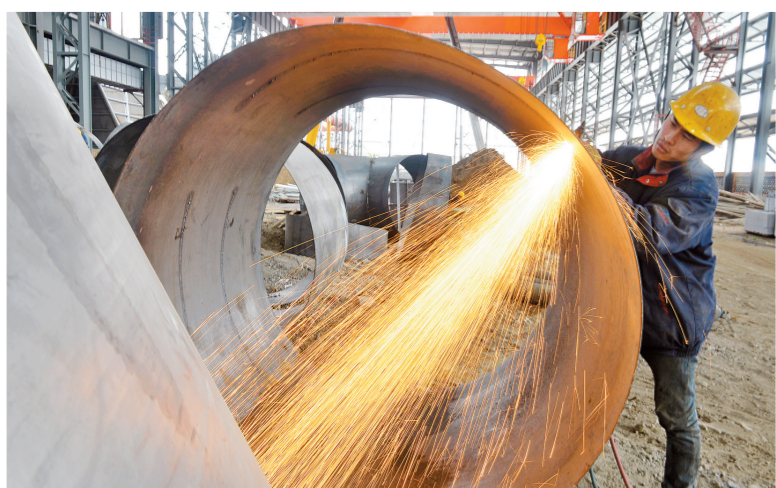
4月16日上午,包头市九原区明拓集团二期工程建设现场,工人师傅正在焊接风机管道,为该项目5月底建成投产做准备。