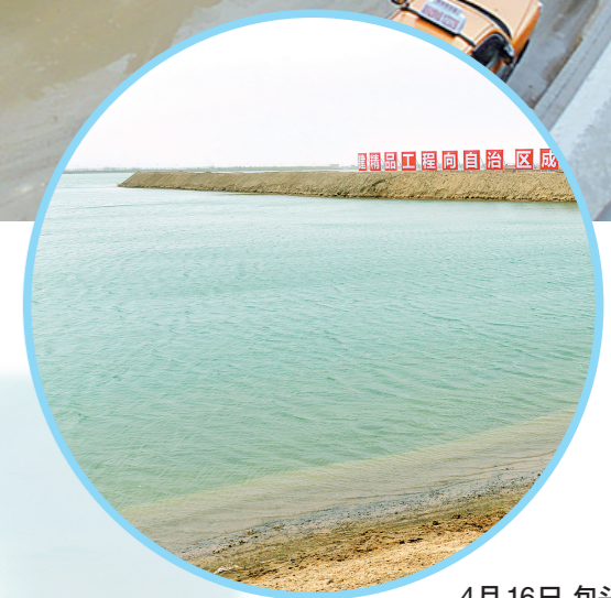
4月16日,包头市滨河新区正在改造中的小白河产业园一角。