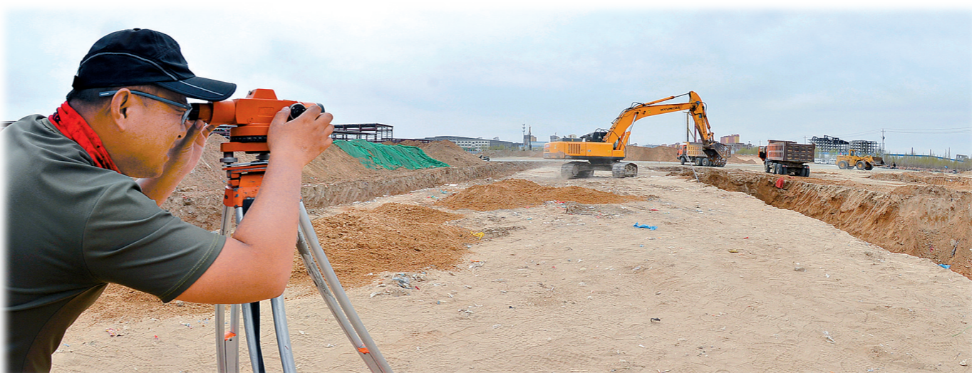
4月15日,包头昊明稀土新能源科技有限公司稀土新电源产业化项目现场,工作人员正在进行工程测量。