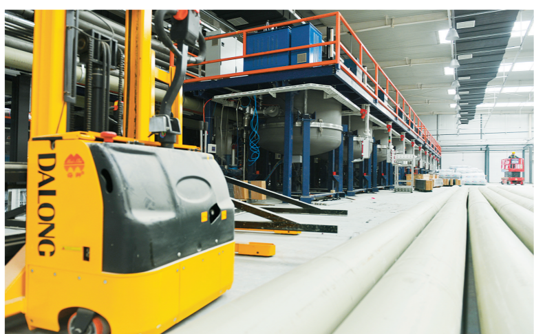
4月15日,包头市加拿大阿特斯公司3GW太阳能铸锭切片及600MW电池组件项目施工现场,工作人员正在安装设备。