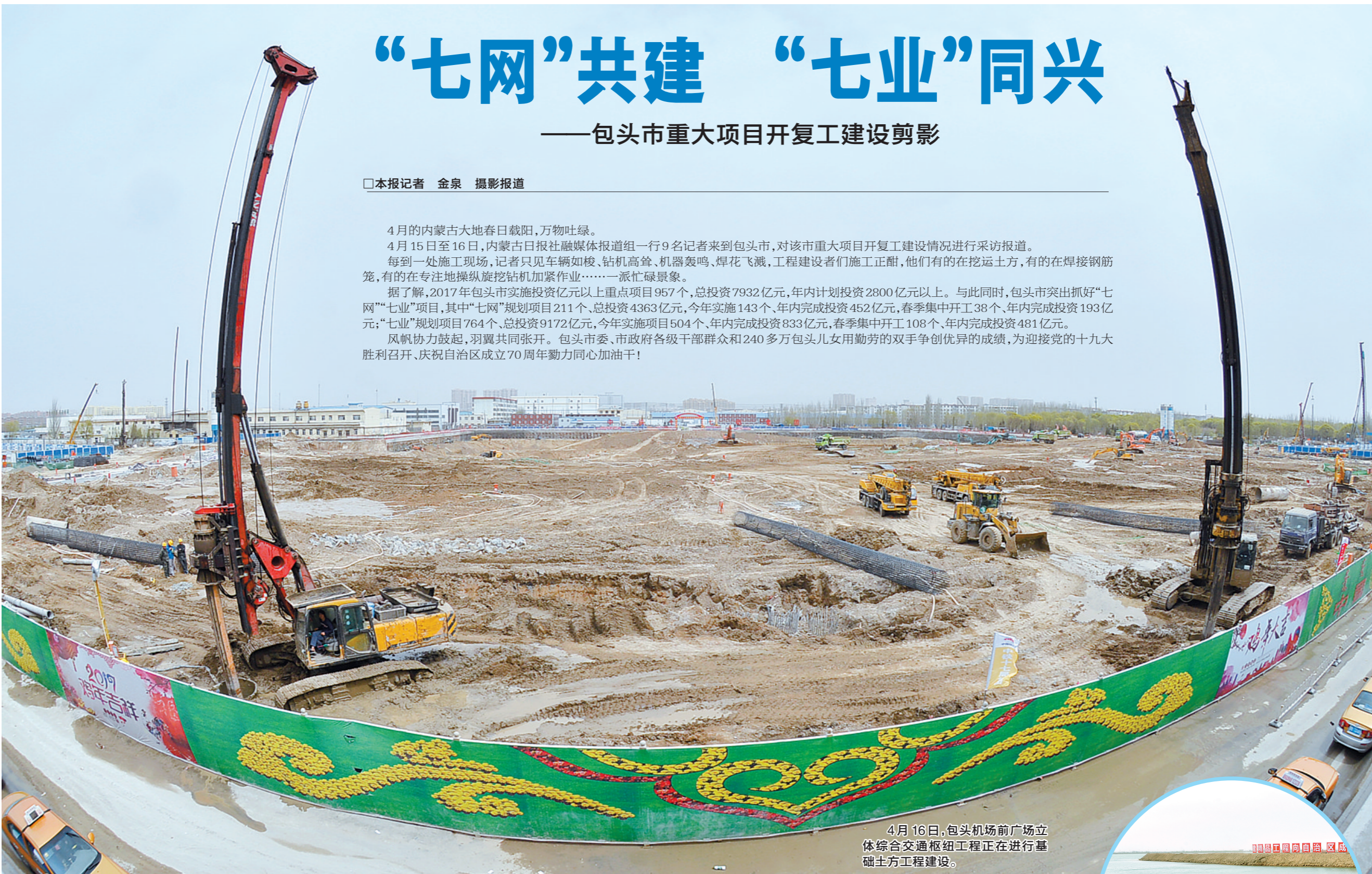
4月16日,包头机场前广场立体综合交通枢纽工程正在进行基础土方工程建设。

4月的内蒙古大地春日载阳,万物吐绿。4月15日至16日,内蒙古日报社融媒体报道组一行9名记者来到包头市,对该市重大项目开复工建设情况进行采访报道。每到一处施工现场,记者只见车辆如梭、钻机高耸、机器轰鸣、火花飞溅,工程建设者们施工正酣,他们有的在挖运土方,有的在焊接钢筋笼,有的在专注地操纵旋挖钻机加紧作业……一派忙碌景象。 据了解,2017年包头市实施投资亿元以上重点项目957个,总投资7932亿元,年内计划投资2800亿元以上。与此同时,包头市突出抓好“七网”“七业”项目,其中“七网”规划项目211个,总投资4363亿元,今年实施143个,年内完成投资452亿元,春季集中开工38个,年内完成投资193亿元;“七业”规划项目764个,总投资9172亿元,今年实施项目504个,年内完成投资833亿元,春季集中开工108个,年内完成投资481亿元。 风帆协力鼓起,羽翼共同张开。包头市委、市政府各级干部群众和240多万包头儿女用勤劳的双手争创优异的成绩,为迎接党的十九大胜利召开、庆祝自治区成立70周年勠力同心加油干!