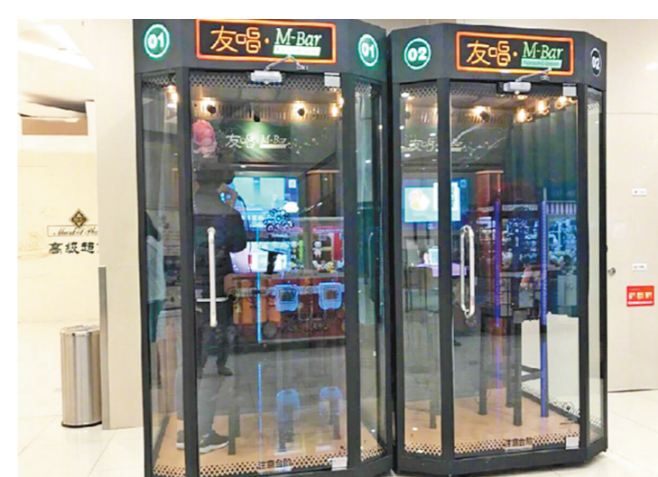
在一家大型商场的自助唱吧里消费者独自唱歌。

其实国内的一些地方已经出现了全自动微信预约的自助健身舱。里面没有一位教练和工作人员，无需办年卡、无销售介入、按次自助消费。虽然一