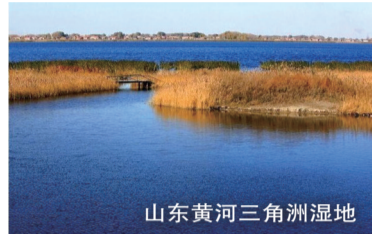
山东黄河三角洲湿地