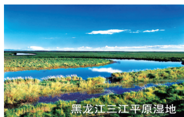
黑龙江三江平原湿地