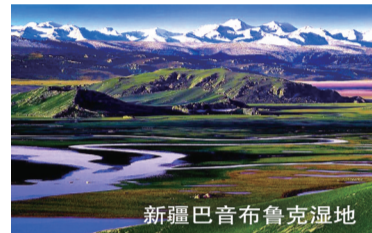
新疆巴音布鲁克湿地