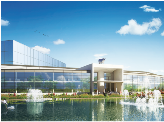
花吐古拉工业园区办公楼。