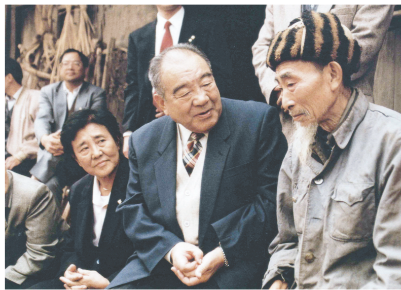
1995年,布赫同志在广西都安瑶族自治县了解农民生活情况。