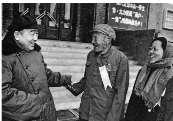
1984年,布赫同志与出席集宁“两户、一体”先进集体、个体表彰会的农民亲切交谈。