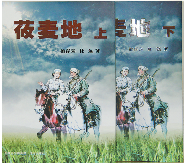
作者:梁存喜 杜远 出版社:内蒙古出版集团 远方出版社

思考历史是作家的必然选择,也是使命和责任所在。对于成立70年的内蒙古自治区而言,和平繁荣的70年,是中国共产党领导各族人民在北方辽阔大地上进行艰苦卓绝革命斗争的结果。那可歌可泣的历史,已是作家写作的宝库。《莜麦地》取材于80年前的一段革命历史,绥中抗日的战火和解放战争的硝烟伴着莜麦悠长的清香,在小说中真切弥漫。革命中重要的历史事件,比如党有意在草原上选择以奇剑啸为代表的这批蒙古王公贵族后代到延安接受党的教育,培养革命中坚力量的往事;以及大青山八路军骑兵团和根据地的建立和壮大过程等都在小说中得到生动反映。以奇剑啸和贾兰为代表的共产党人强健自身的同时,直面土匪、国民党及日本人等组成的犬牙交错的复杂局面,又以民族大义收服土匪、与国民党针锋相对、同日本人殊死斗争,跌宕起伏的斗争进程构成小说的主体,厚重的历史如画卷般铺展,小说