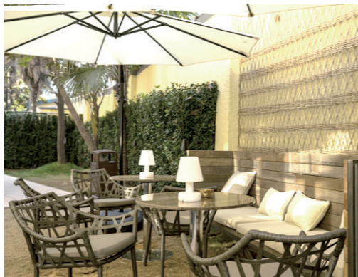
隐居繁华雅集公馆