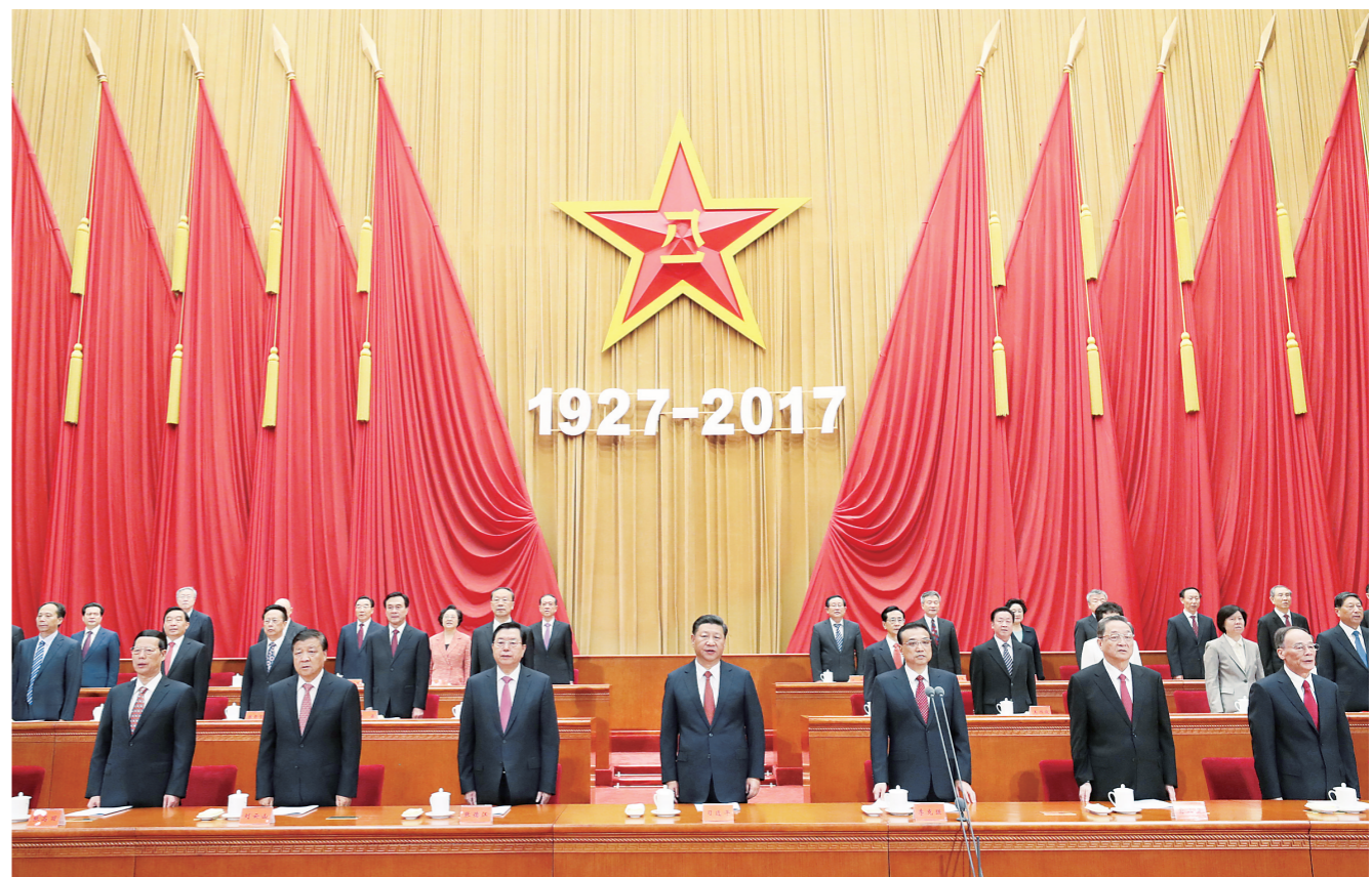
8月1日,庆祝中国人民解放军建军90周年大会在北京人民大会堂隆重举行。中共中央总书记、国家主席、中央军委主席习近平在大会上发表重要讲话。