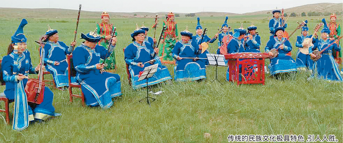
传统的民族文化极具特色，引人入胜。