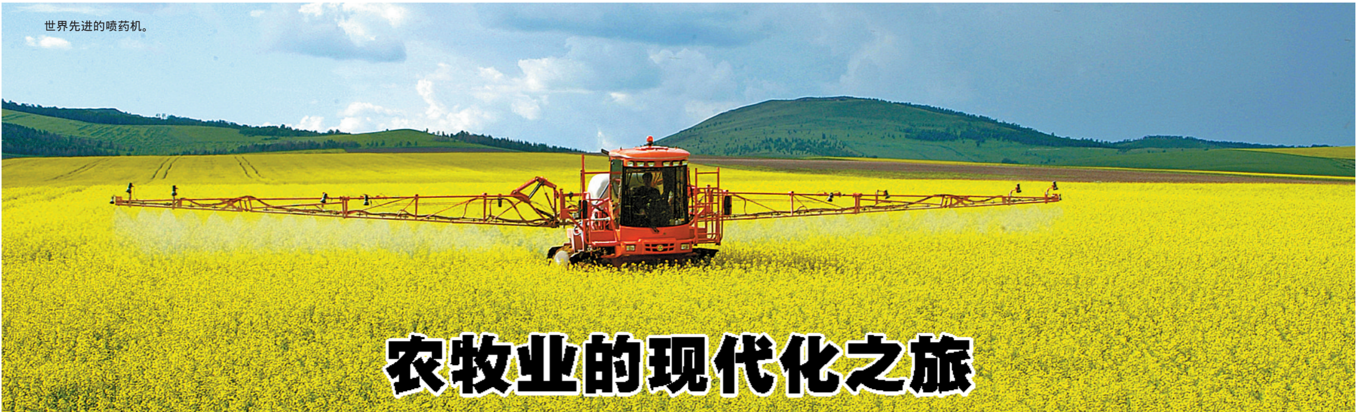
世界先进的喷药机。