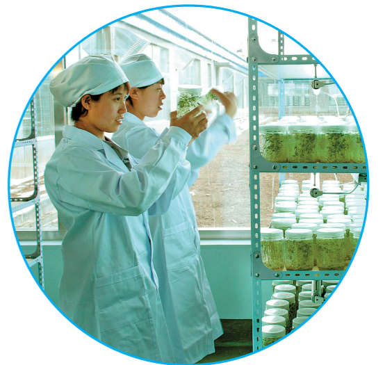
乌兰察布市脱毒马铃薯瓶苗生产间。