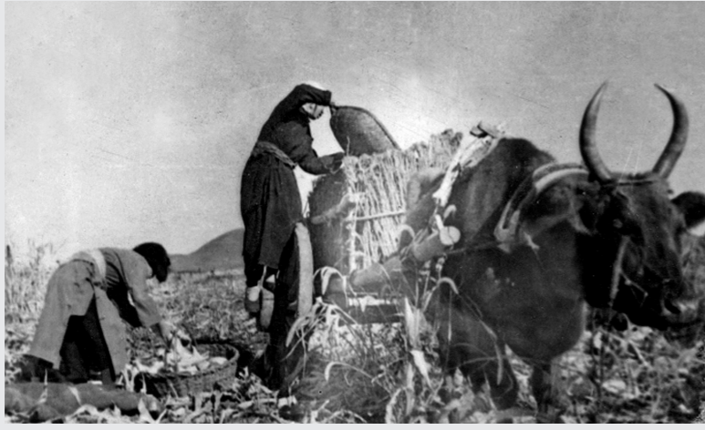
1950年9月格根庙乡蒙古族农民收玉米。

2017年8月3日 星期四 执行主编:孙一帆 责任编辑:安海东 版式设计:苏昊 制图:安宁