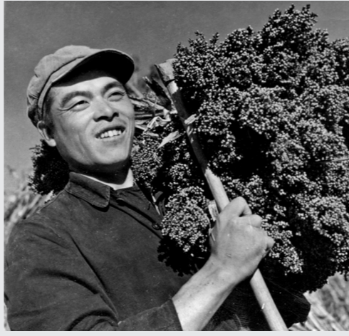
1960年9月,通辽钱家店人民公社丰收的喜悦。