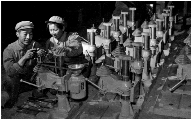
1973年4月,土默特左旗农牧业机械修造厂工人在安装小台钻。