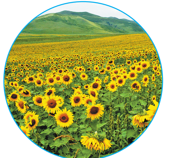
兴安盟科右中旗油葵种植基地。