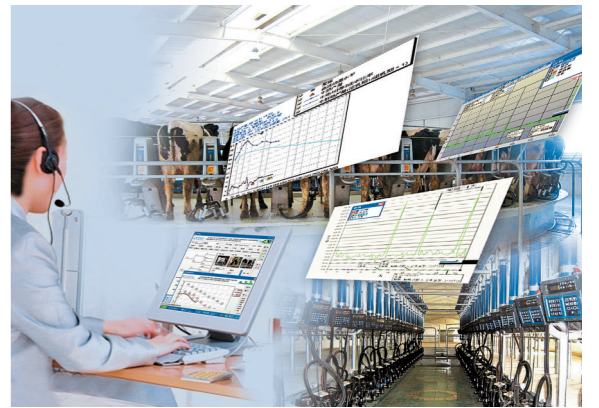
示范园区牧场均使用数字化管理系统。