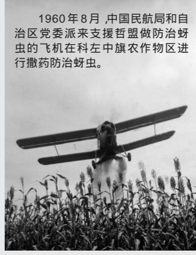
1960年8月,中国民航局和自治区党委派来支援哲盟做防治蚜虫的飞机在科左中旗农作物区进行撒药防治蚜虫。