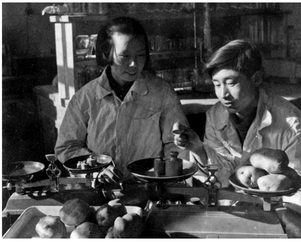
1962年乌兰察布盟农业科学研究所马铃薯研究小组人员正在测定马铃薯的淀粉成分。

在部分地区旱灾严重的情况下,粮食总产达到556.04亿斤,全区粮食生产实现十三连丰,连续4年稳定在550亿斤以上,畜牧业实现十二连稳,全区牲畜存栏连续12个牧业年度超过1亿头只,当年达到1.36亿头只。农牧业经济呈现出总体平稳、稳中有进的良好态势,实现了十三五的良好开局。