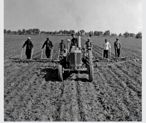
1960年6月 钱家店公社实现农业机械化,加强农业机械的统一调配和使用,田间管理工作不断加强。