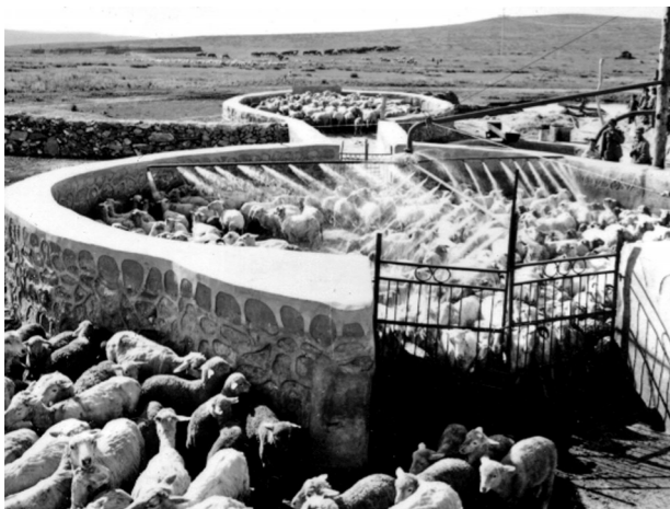
1977年7月,锡林郭勒牧场八连的机械化药浴。