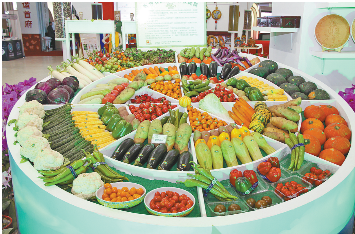
丰富的农产品亮相在各大农产品博览会上。