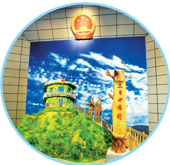
图片和实物展现三角山哨所。