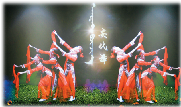
虚拟成像演示安代舞。