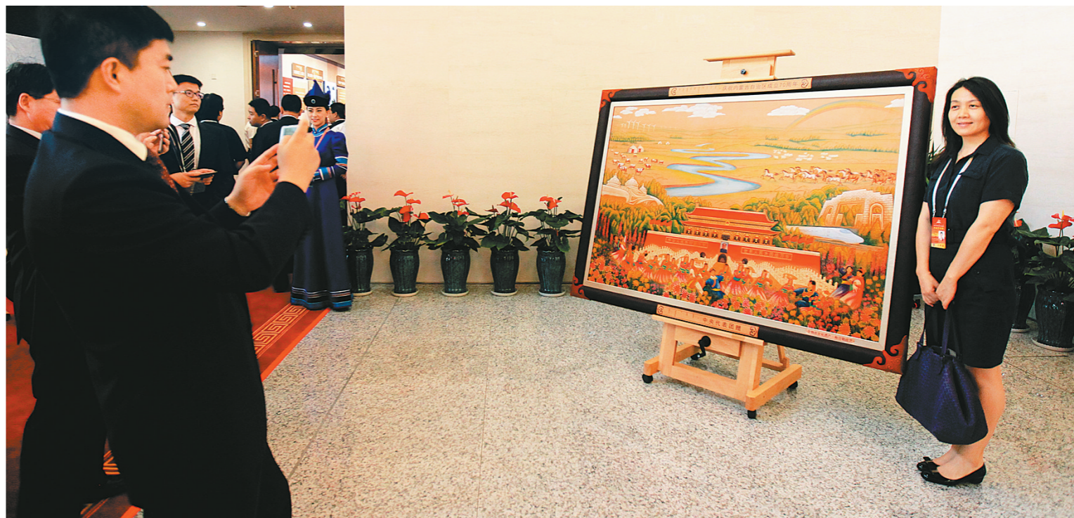
参观者在中央代表团赠送的皮画旁留影。

8月7日上午,《守望相助 团结奋斗——庆祝内蒙古自治区成立70周年展览》在内蒙古展览馆拉开序幕。展览以“革命风云,建立我国第一个少数民族自治区”“艰苦创业,民族区域自治的探索与实践”“扬帆起航,开创改革开放现代化建设新局面”“抢抓机遇,实现新世纪新阶段发展新跨越”“守望相助,打造祖国北疆亮丽风景线”等五个单元组成,通过大量图片、图表、丰富翔实的历史文献和实物以及生动新颖的多媒体演示,全景式展示了内蒙古自治区70年来经济社会发展所取得的辉煌成就。