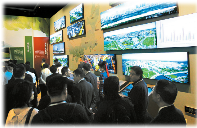
观看城市建设成果展示。