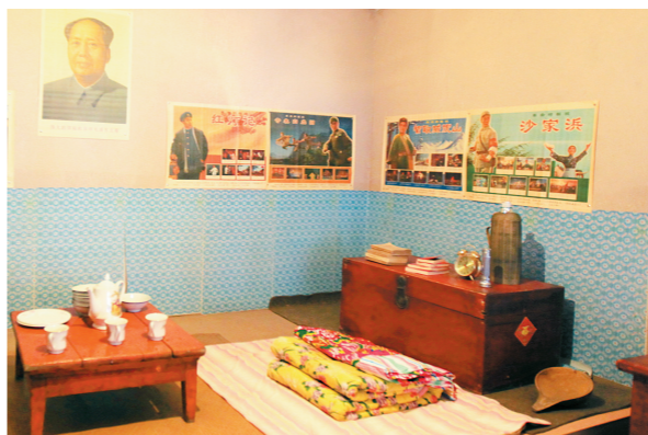
实景展示60年代民居。