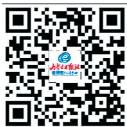
新闻连连看 扫一扫,看视频