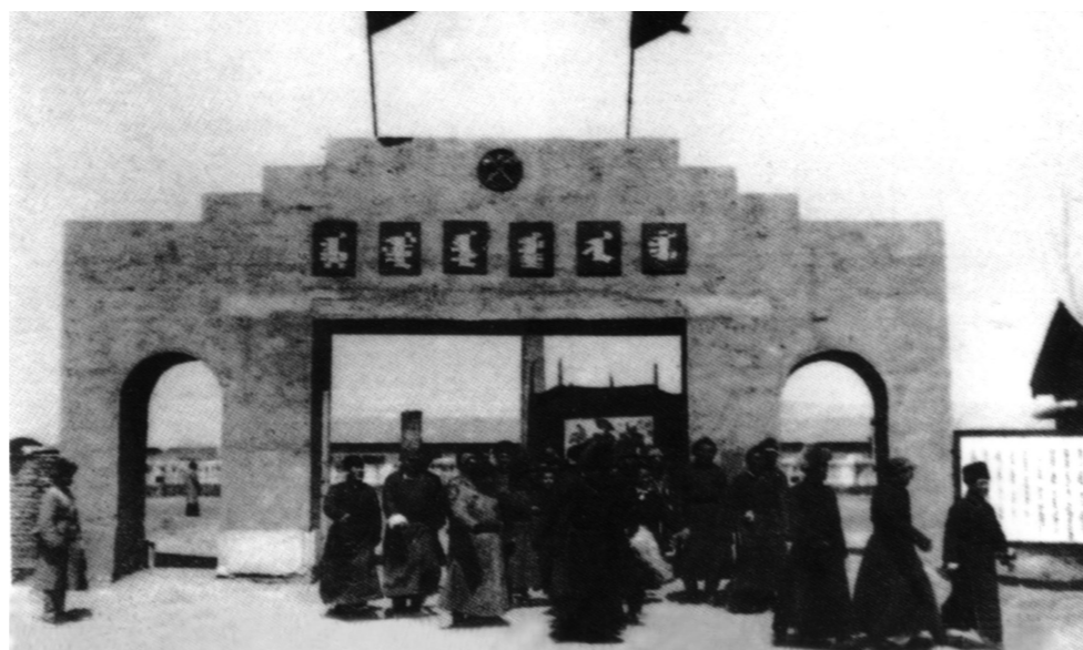
1947年5月，参加内蒙古人民代表会议的代表们走出会场。

一马当先七十载，万马奔腾谱新篇。站在新的起点，我们将守望相助、团结奋斗、一往无前，努力把祖国北部边疆这道风景线打造得更加亮丽。