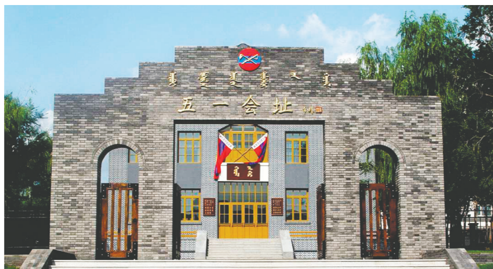
乌兰浩特市五一会址。