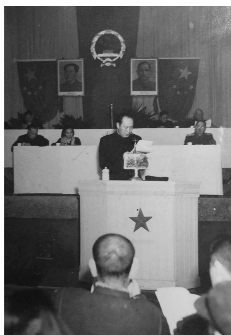
1954年8月，内蒙古自治区第一届人民代表大会第一次会议上乌兰夫同志在讲话。