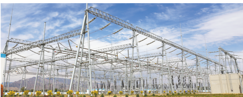
梅力更变电站，内蒙古电网第一座500千伏智能变电站。