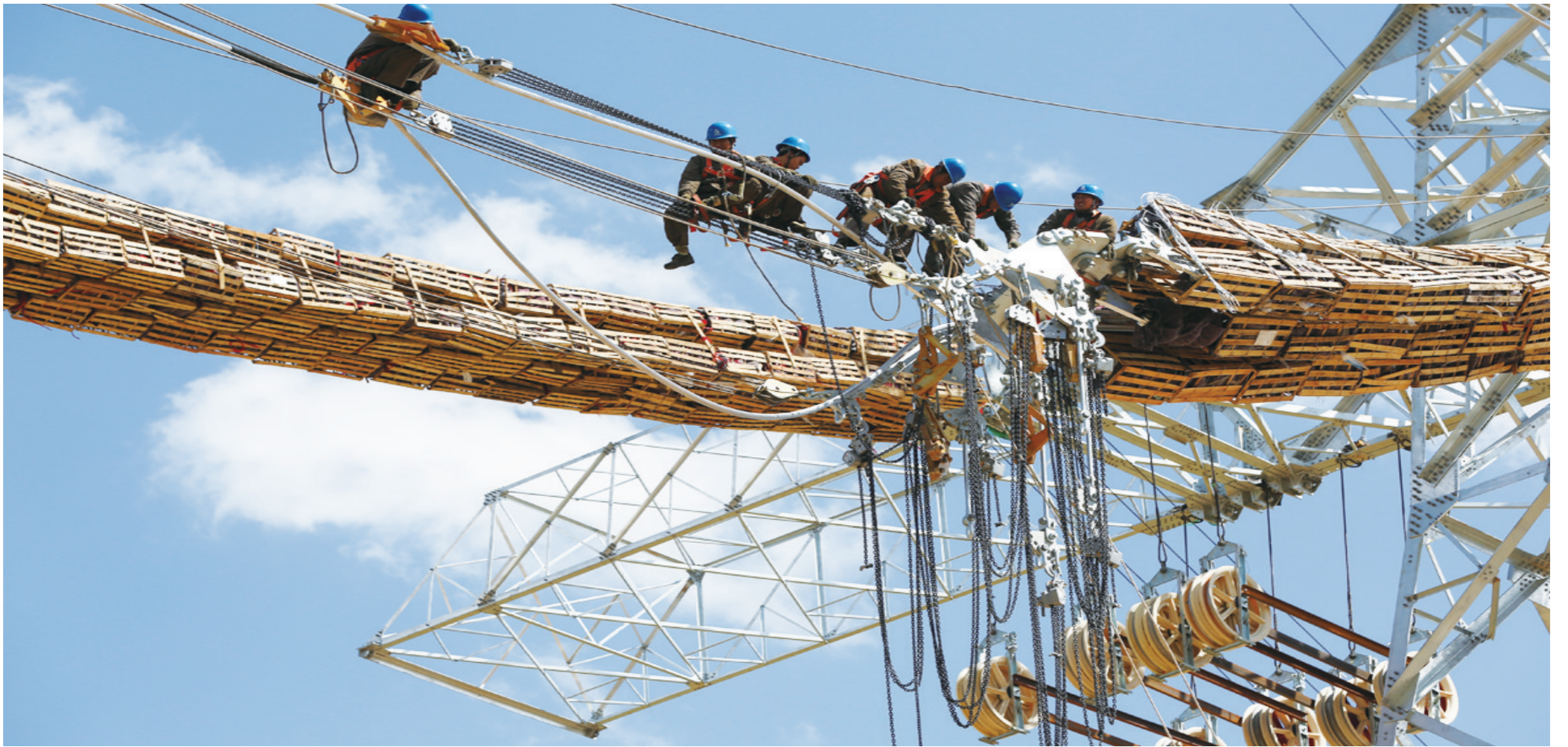
忙碌在线路上的电力工人。