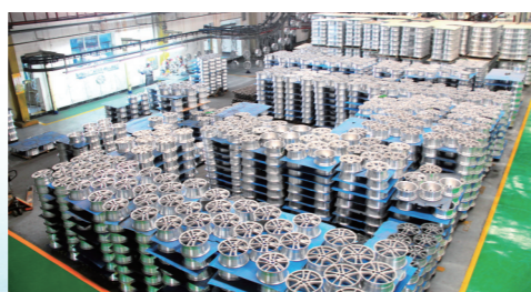
内蒙古立中霍煤车轮制造有限公司铝轮毂仓储区。

聚焦高端发展,推动绿色转型,率先全面建成小康社会是霍林郭勒跨越发展的不懈追求。如今,12万勤劳、睿智、勇敢的霍林郭勒各族儿女,不忘初心,守望相助,以创业再出发的实际行动,再燃创业斗志。