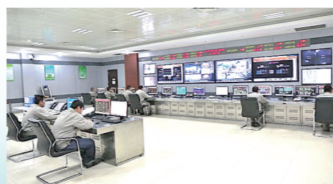
锦联铝材电厂主控室。