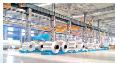
联晟新能源材料公司生产车间。