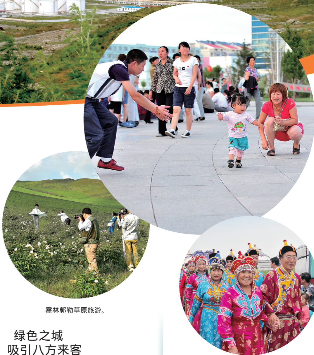
幸福一家人

郭天宝说:力争到十三五末,实现煤炭产销4500万吨以上,电力装机突破700万千瓦,区域微型电网建成运行,原铝产量突破300万吨,以铝板带箔、轨道交通、汽车轻量化为主要品种的中高端产品加工转化率达到80%以上,各类工业废弃资源全部循环利用,吃干榨尽。