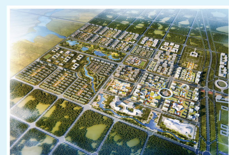
内蒙古和林格尔新区金融小镇效果图

目前,总投资66.26亿元的快速交通、机场枢纽、生态绿地、河道治理、地下综合管廊等10个市政基础设施项目已经启动实施,总投资1000亿元的E级超级计算机、生物检测、稀土永磁电机、大数据云计算等48个高精尖项目已和国际国内顶级领先企业接洽对接,总投资144亿元的数聚、金融、教育等3个特色产业小镇开工建设,圆满完成新区“一年起步”的目标任务,以优异成绩迎接党的十九大胜利召开、庆祝自治区成立70周年。