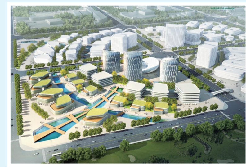
内蒙古和林格尔新区数聚小镇效果图