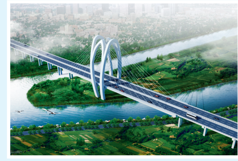
金盛路跨大黑河草场跨桥效果图