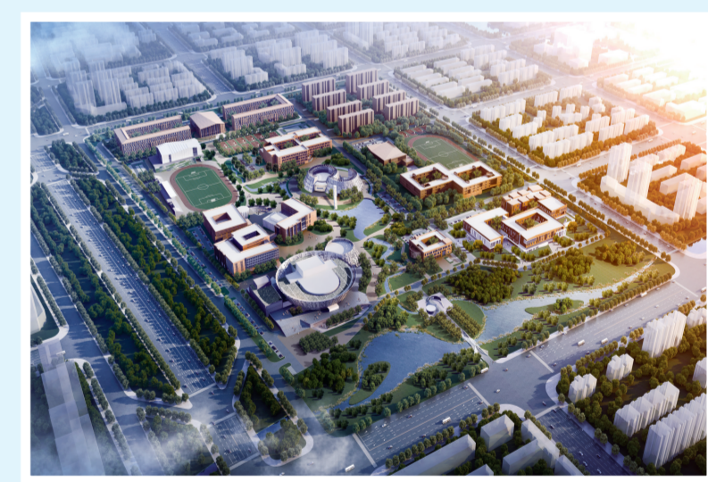
内蒙古和林格尔新区教育小镇——内蒙古艺术学院效果图