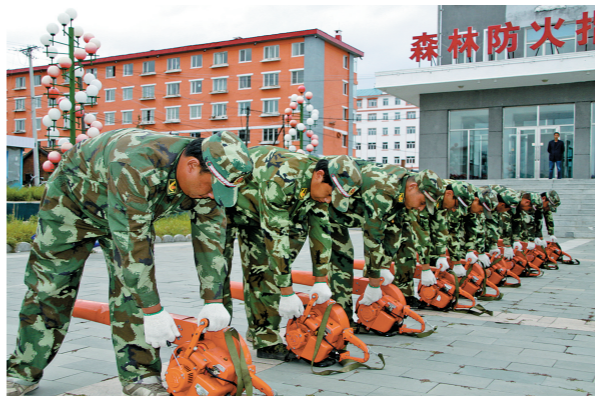
快扑队员训练。