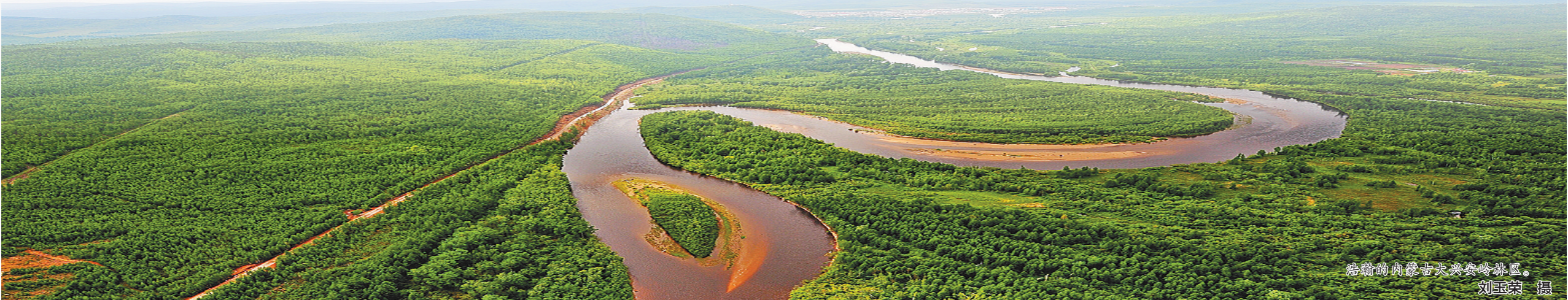
翰翰的内蒙古大兴安岭林区。