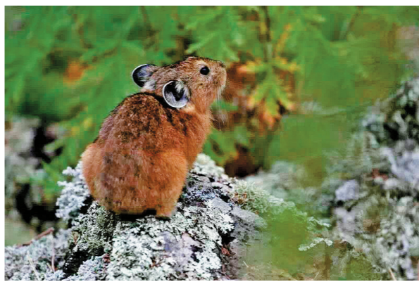
在林区无忧无虑生活的石兔。

实战演练和培训,提升各级防扑火指战员的战斗力;严格调度值班和领导带班制度,严格执行火灾“零报告”制度。各单位主要领导对防火工作必须亲自研究部署,分管领导、包片领导、督导组必须认真履行责任。对责任不落实、措施不到位、隐患不整改、扑救不得力以及隐瞒不报火情等失职、渎职行为,严肃追究相关人员的责任,切实提高各级干部的危机感、责任感。