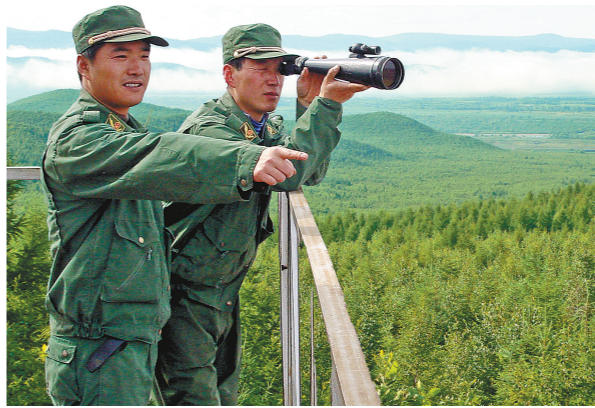
防火瞭望。

用最严密的措施强化制度建设。对《林区森林火灾应急预案》进行再修订、再完善;制定了《关于进一步加强森林防火工作的意见》《林区开展森林防火集中整治专项行动方案》,成立专项调查组,在全林区范围开展3个月的集中专项整治,全面提升森林防火工作整体水平。积极开展