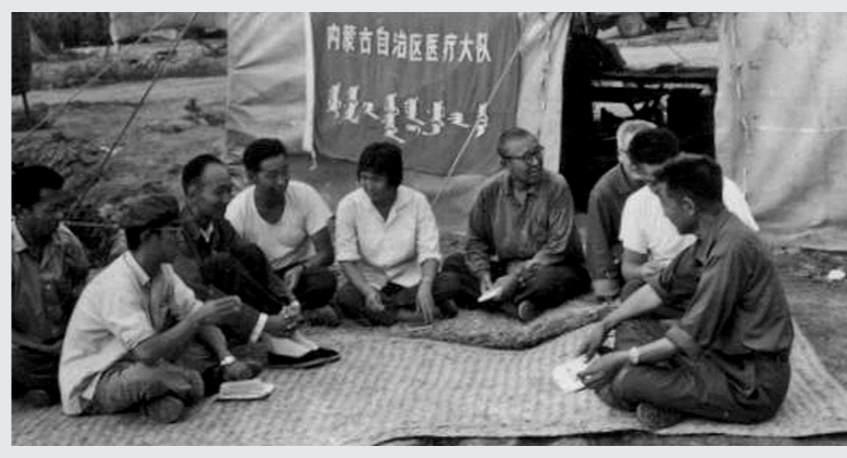
1976年9月,我区抗震救灾医疗队党委成员召开会议,学习中央抗震救灾先进单位和模范代表大会的精神。