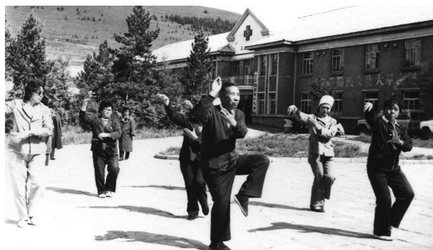
1987年7月在阿尔山工人疗养院疗养的人们,进行体育锻炼。