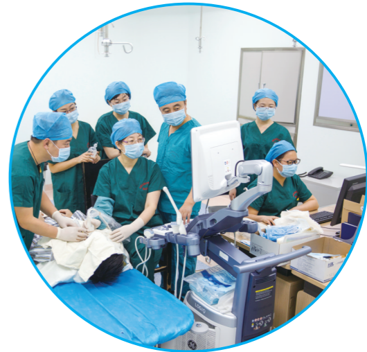
先进的超声介入诊疗。