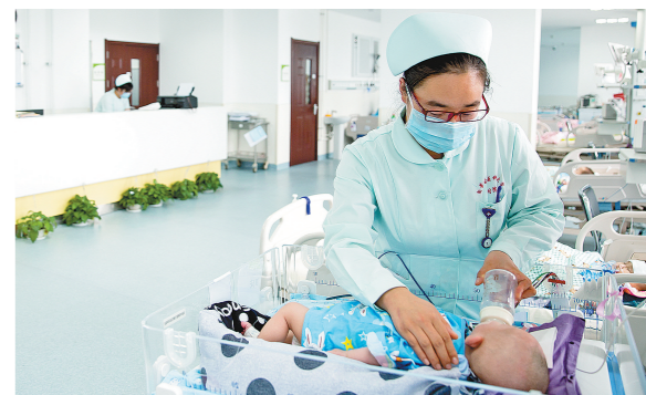
2015年11月,内蒙古医科大学第一附属医院新建成的儿科PICU重症监护室内,医务人员为新生儿做护理。