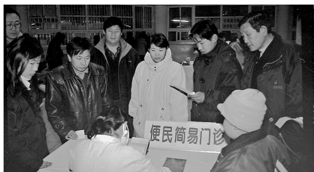
2004年4月呼和浩特市市民在呼和浩特市第一医院便民简易门诊等候就诊。