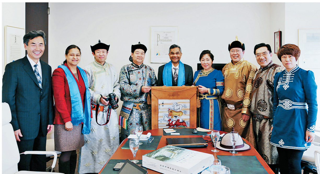
2013年2月,蒙医药专家赴纽约参加联合国会议期间,受到世界卫生组织驻联合国纽约总部大使库玛艾森的接见。