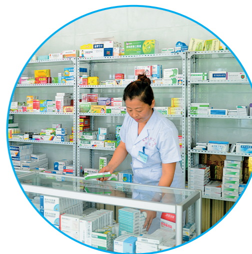
2014年7月,通辽市开发区新农村村医在卫生室整理药物。