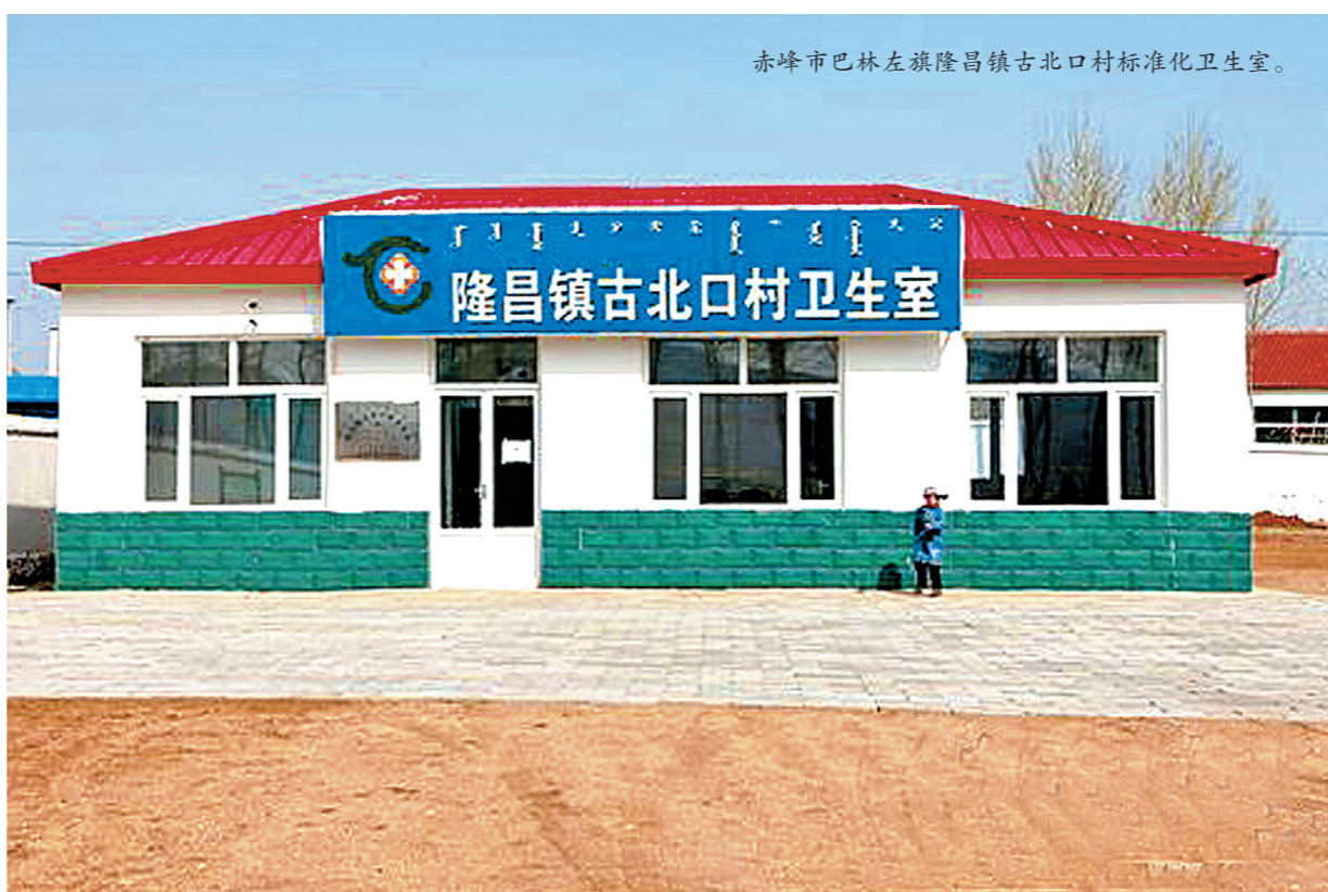
赤峰市巴林左旗隆昌镇古北口村标准化卫生室。