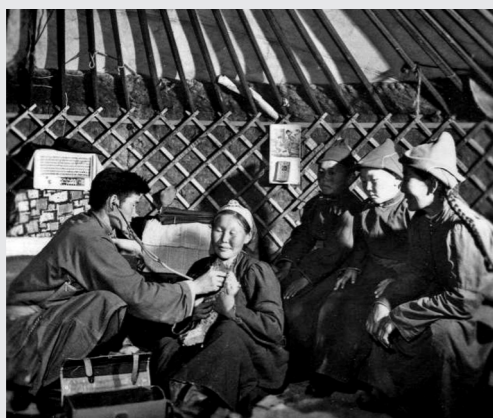
1965年8月鄂温克族自治旗各行各业为牧民走敖特服务。