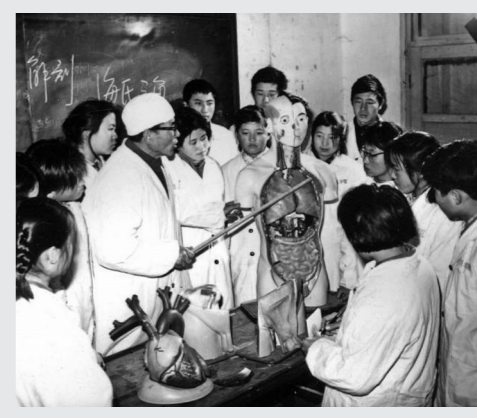
1981年1月哲里木民族医学院解剖学讲师正给妇幼士班的学员讲人体解剖课。