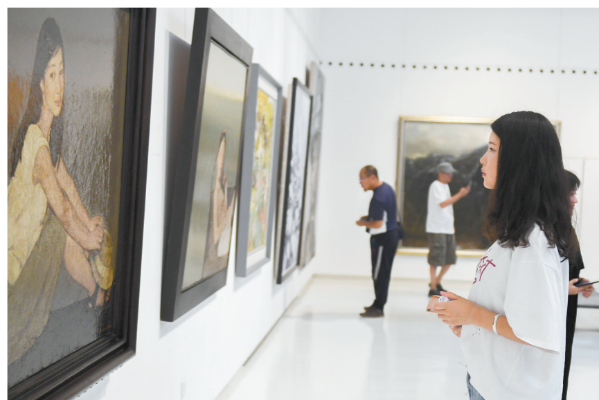
在呼和浩特市斯塔娜艺术博物馆,举行了“草原之约——中国油画名家邀请展”。本次画展以画为媒,庆祝自治区成立70周年。