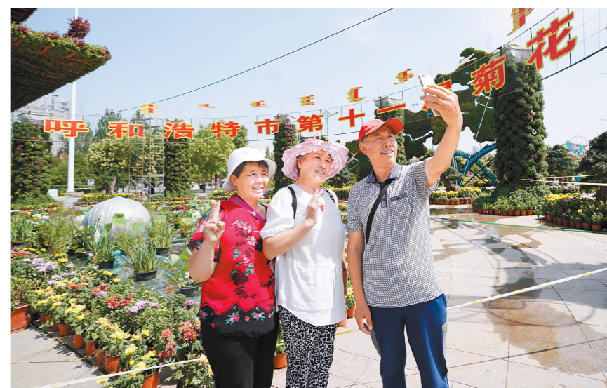
为了让首府市民切实体会到70年来城市面貌翻天覆地的变化,呼和浩特市第十一届菊花展开展日期由往年的9月中旬提前到了8月11日,展期也由1个月延长到了2个月,菊花展预计使用5万盆鲜花扮靓青城。

“中央对军工职工的关怀让企业职工都非常兴奋。”一机集团五分公司党委书记何娟介绍:“我们的企业承担两个维护,一是维护国家的国防安全,二是维护我们企业的建设,我们要造最好的装备来为我们的企业、我们的国家保驾护航。”