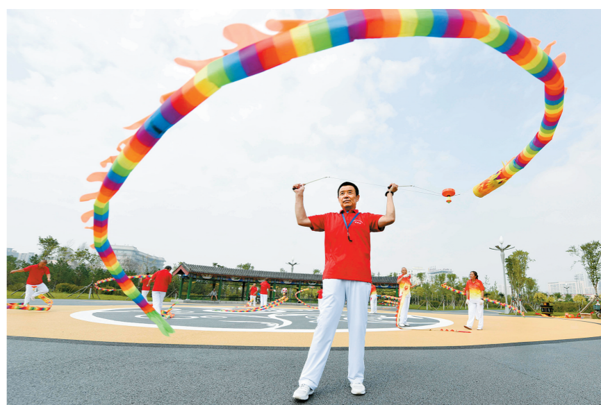
在呼和浩特市草原丝绸之路主题公园,表演者表演了多个空竹龙节目,祝贺内蒙古自治区成立70周年。