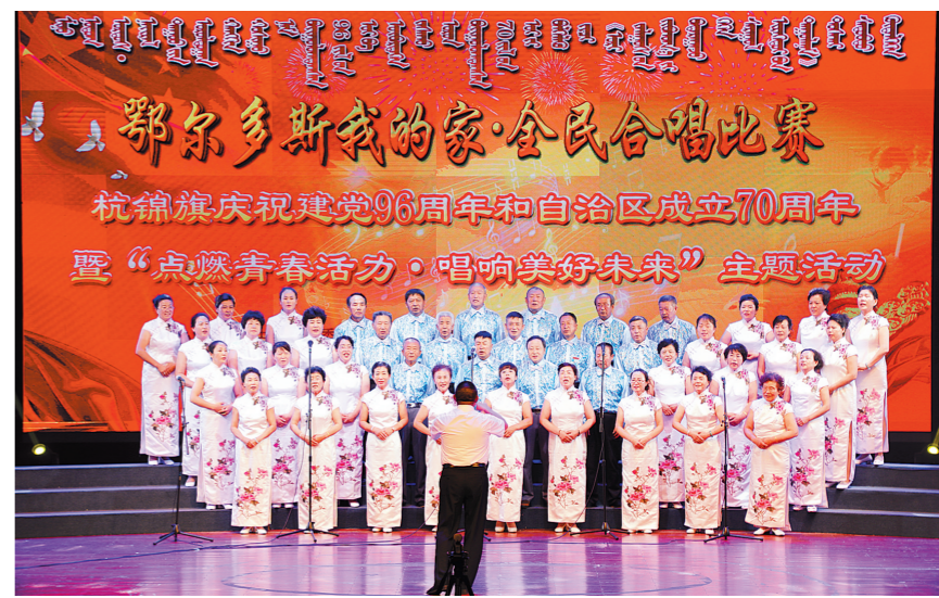
杭锦旗开展“鄂尔多斯我的家·全民合唱比赛”,庆祝自治区成立70周年。