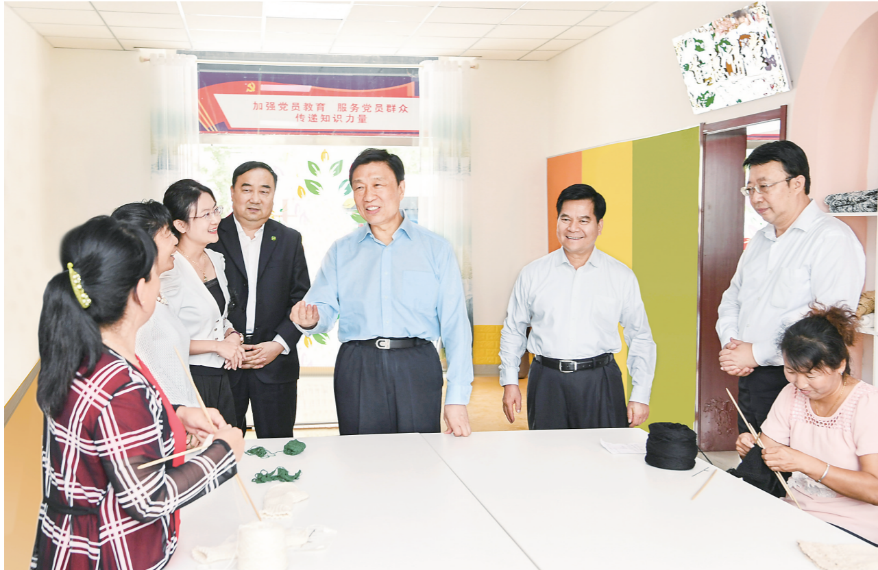
9月4日,中共中央政治局委员、国家副主席李源潮在自治区党委书记、人大常委会主任李纪恒的陪同下,到呼和浩特市赛罕区金桥社区调研。