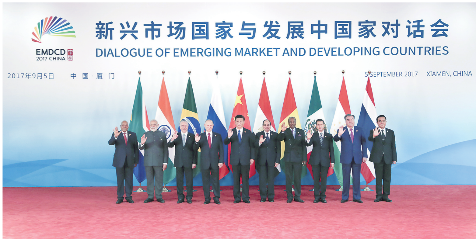
9月5日,国家主席习近平在厦门国际会议中心主持新兴市场国家与发展中国家对话会并发表重要讲话。金砖国家领导人巴西总统特梅尔、俄罗斯总统普京、印度总理莫迪、南非总统祖马和对话会受邀领导人埃及总统塞西、几内亚总统孔戴、墨西哥总统培尼亚、塔吉克斯坦总统拉赫蒙、泰国总理巴育出席对话会。这是对话会前,习近平同出席对话会的各国领导人集体合影。