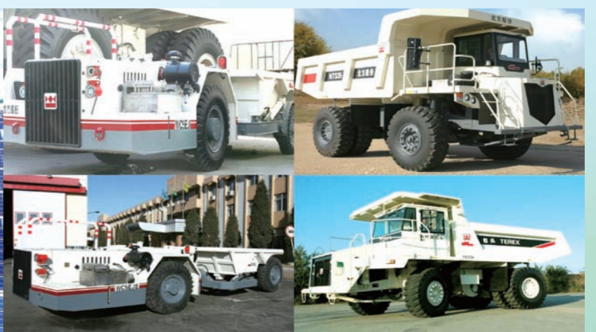
支持高端装备制造项目。