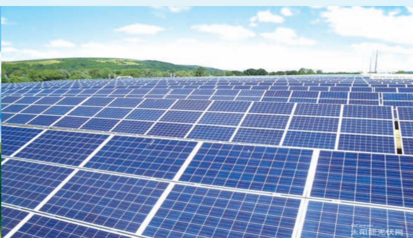
支持太阳能光伏发电项目。