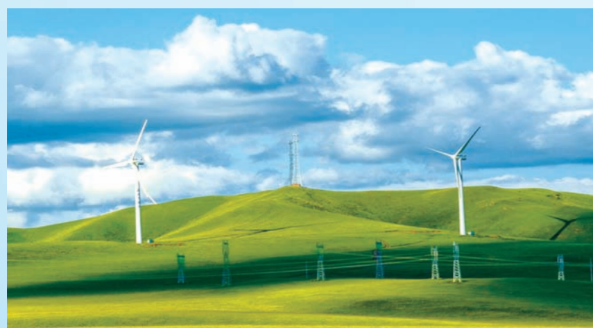
支持风力发电项目。