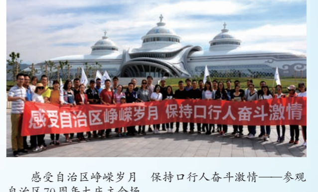
感受自治区峥嵘岁月 保持口行人奋斗激情——参观自治区70周年大庆主会场。