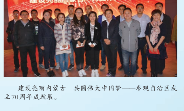
建设亮丽内蒙古 共圆伟大中国梦——参观自治区成立70周年成就展。