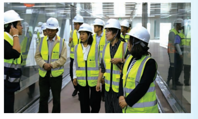
调研企业生产经营现场。