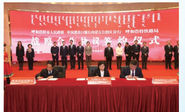
分行成立及签约仪式。